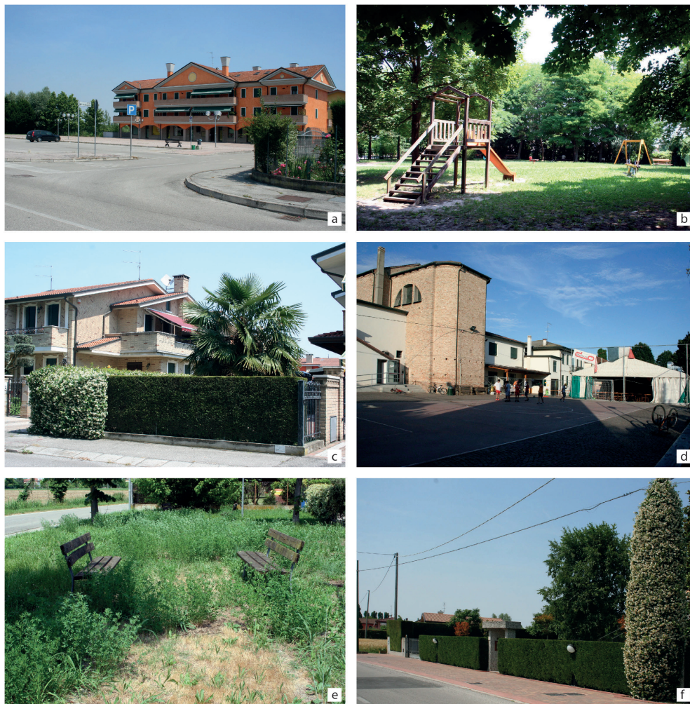
Fig. 2 – Spazi privati, pubblici e collettivi: a) e b) la piazza M. T. di Calcutta e il Parco, i due spazi pubblici maggiormente citati nelle interviste; c) una casa privata; d) l’area dietro alla chiesa, con il cosiddetto “baraccon”; e) panchine in uno spazio pubblico; f) siepi in un giardino privato.

abitanti si comportano sia come attori che come spettatori e nell’attribuire valore fanno riferimento soprattutto alla dimensione sociale. Il senso di appartenenza alla comunità locale è un fattore determinante nell’indurre le persone a occuparsi di questi luoghi che vengono curati per i significati collettivi che assumono e non per la loro qualità estetica. Ciò avviene ad esempio nell’area intorno alla chiesa dove si ha un notevole coinvolgimento delle persone. Anche nei confronti degli impianti sportivi gli abitanti dimostrano un certo grado di coinvolgimento, sebbene inferiore