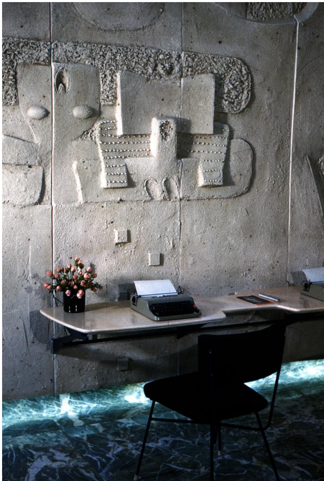
2 | BBPR, Negozio Olivetti di New York, dettaglio dell'allestimento interno con le macchine da scrivere esposte e messe a disposizione per la prova, demolito. Foto d'epoca.