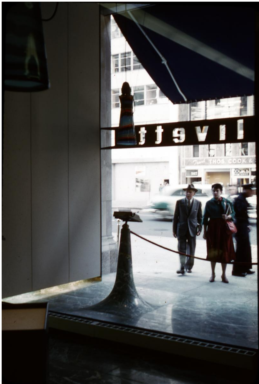
1 | BBPR, Negozio Olivetti di New York, demolito. Foto d'epoca.