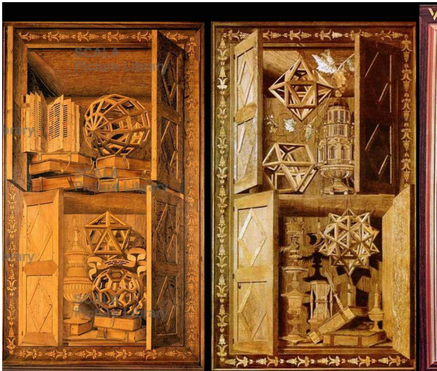
5 | Milton Glaser, manifesto per la Valentine Olivetti , 1969. Montaggio da Fra Giovanni da Verona, Armadi con poliedri , tarsie lignee, 1519-1523, sacrestia di Santa Maria dell'Organo, Verona.