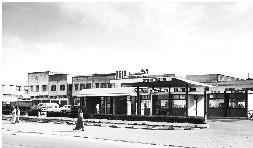
2 | Stazione di servizio Agip, Casablanca, 1962.