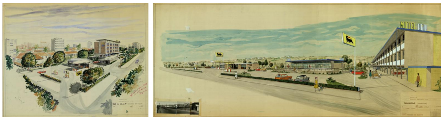
6 | Motel Agip a Dar Es Salaam, 1961.

sviluppo economico di quei paesi, visto che queste strutture rappresentavano per l'intera Africa un'assoluta novità.