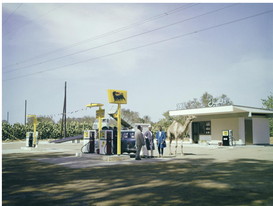
5 | Stazione di servizio in Libia (Tripoli o Bengasi, luogo non identificato) fra il 1963 e il 1966.

architetti francesi e italiani a cavallo della Seconda guerra mondiale. Si pensi, solo per limitarci a un paio di esempi, a progetti come la villa Sami Suissa a Casablanca realizzata da Jean François Zevaco nel 1947, oppure alle molte architetture moderniste di Asmara e, su tutte, alla stazione di servizio – evidentemente un tipo che ben si presta alle sperimentazioni architettoniche – di Fiat Tagliero progettata da Giuseppe Pettazzi nel 1938.