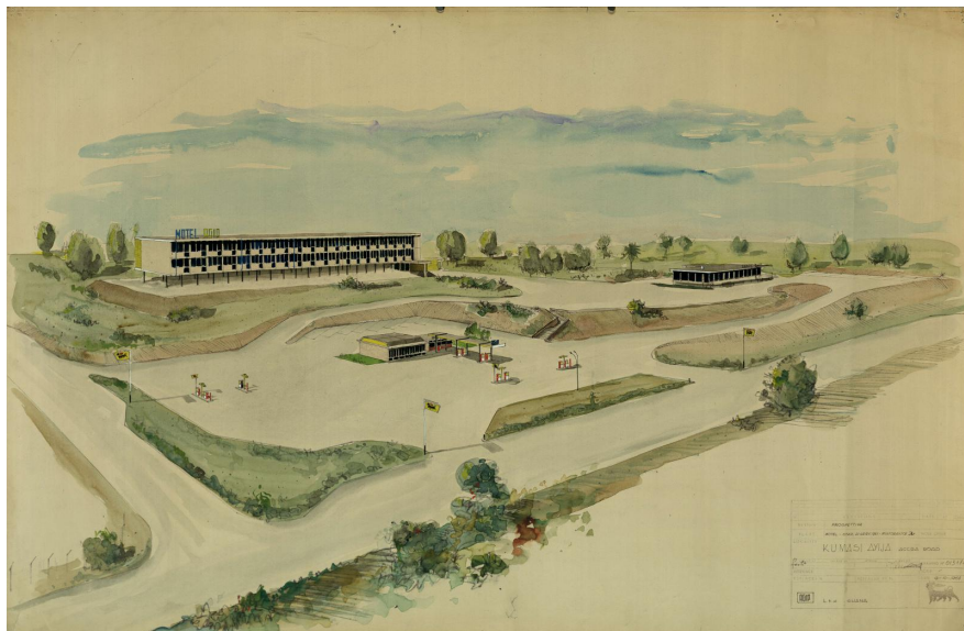
8 | Motel Agip a Kumasi, 1961.