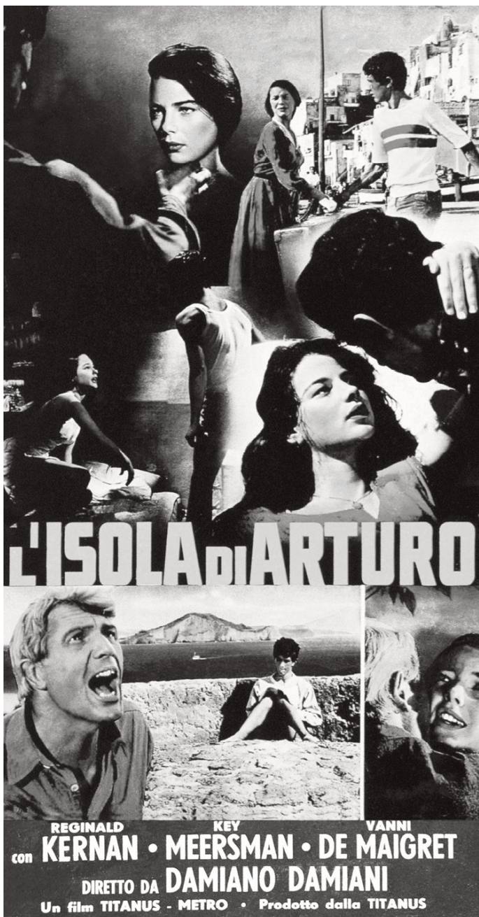
L'Isola di Arturo . Manifesto del film diretto da Damiano Damiani.