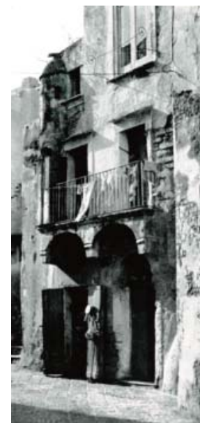
Procida, set cinematografico per L’isola di Arturo . (Critica d’Arte 69)

tura e l’orografia craterica procidana di fatto pervadono prepotentemente ogni pagina del romanzo.