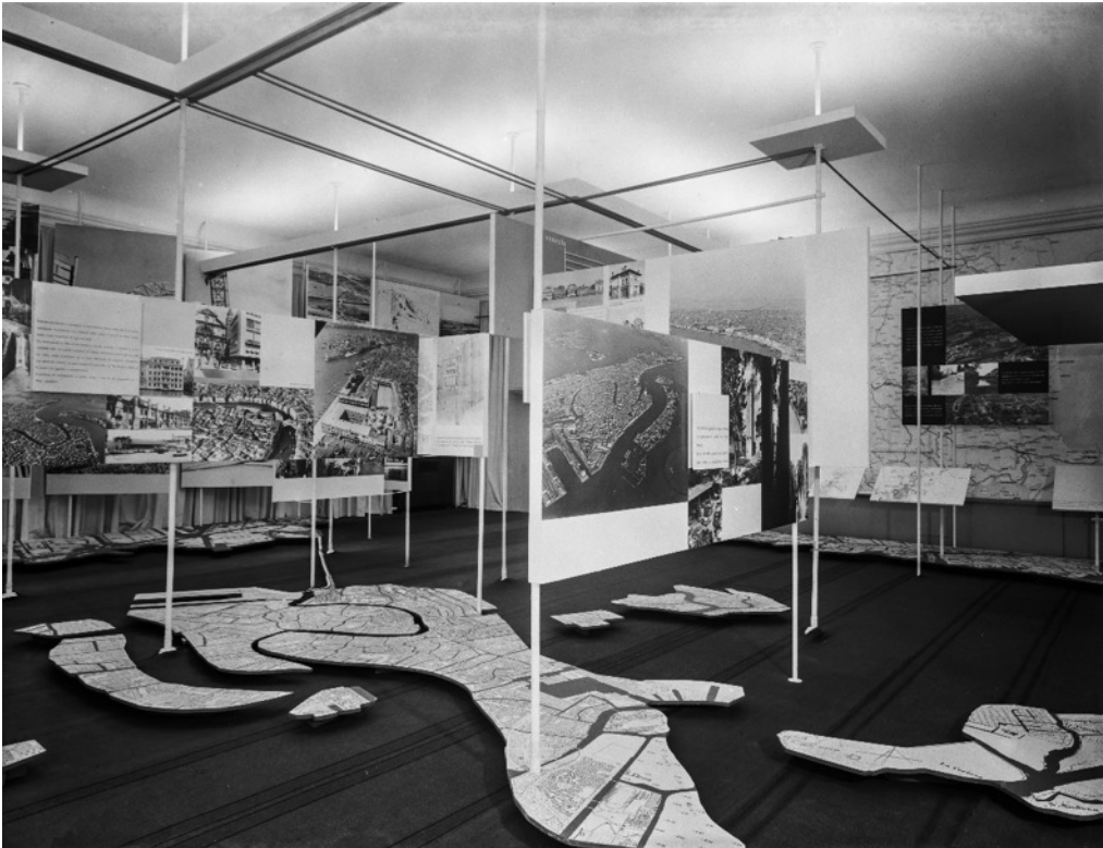
1: Venezia viva, mostra, Venezia, Palazzo Grassi, 1954. Venezia. Università Iuav di Venezia. CIRCE Laboratorio di cartografia e GIS - Archivio Fotografico Ferruzzi.

continuità con la contemporaneità e, soprattutto, tracciare rotte per il suo futuro: per Egle Renata Trincanato, il cui ruolo è fondamentale, «la Mostra è stata la prima coerente presentazione al pubblico del problema di Venezia» 1 .