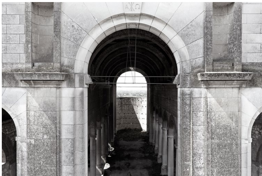
3: Brendola, chiesa di San Michele Arcangelo detta 'Incompiuta'. Navata centrale. Anno 2022.