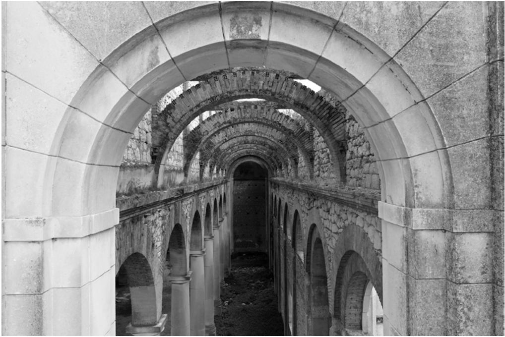
5: Brendola, chiesa di San Michele Arcangelo detta 'Incompiuta'. Navata laterale ovest. Anno 2022.

di rintracciare nella dimensione tangibile, una guida alla conservazione. Le azioni della ricerca hanno quindi promosso un processo di riconoscimento del valore tangibile mediato dalla costruzione della chiesa, con una prima disseminazione delle caratteristiche costruttive, mai analizzate prima, e ritrovando anche in esse, e non solo nel ricordo sociale, una sfida per la restituzione del bene alla comunità.