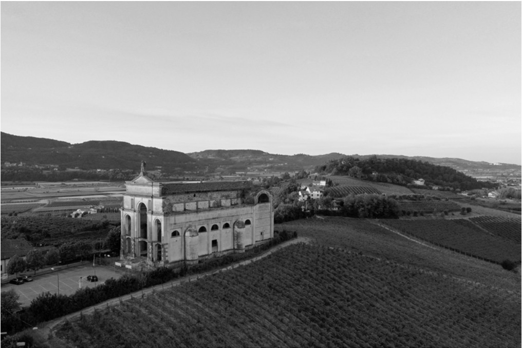
1: Brendola, chiesa di San Michele Arcangelo detta 'Incompiuta'. Inquadramento paesaggistico. Anno 2022.