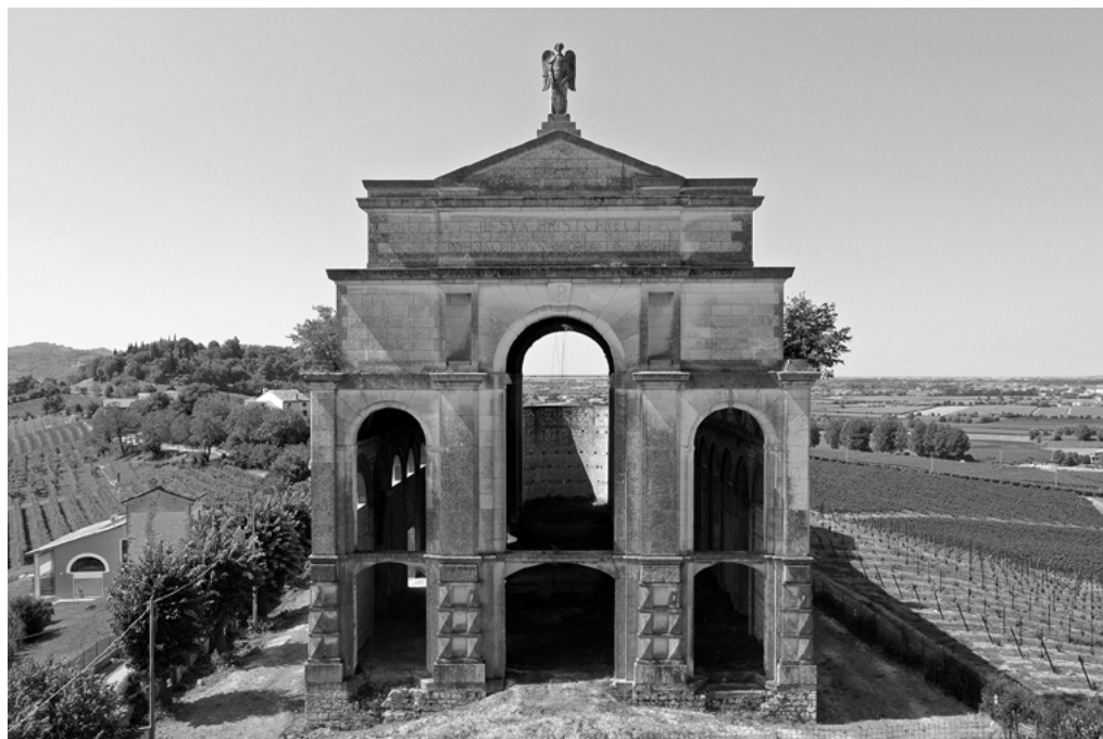
2: Brendola, chiesa di San Michele Arcangelo detta 'Incompiuta'. Facciata principale. Anno 2020.