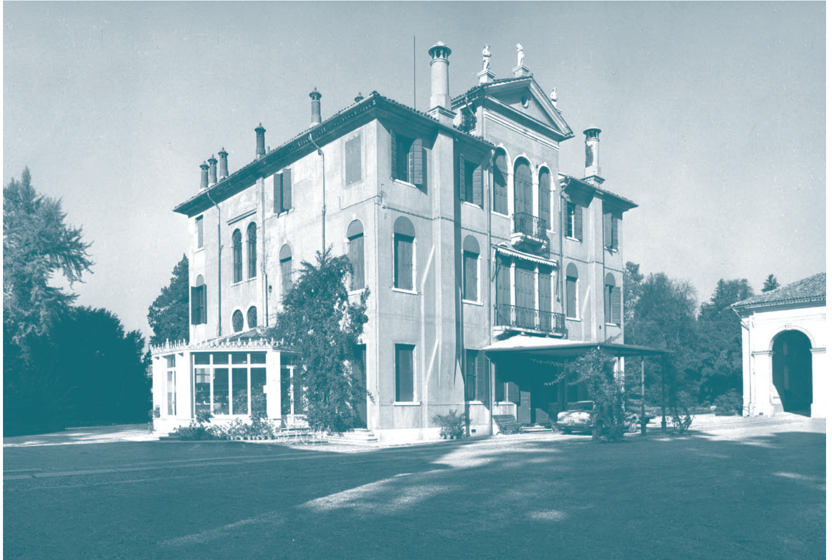
Villa Albrizzi: La Barchessa centrale, Preganziol, anni Settanta del Novecento.