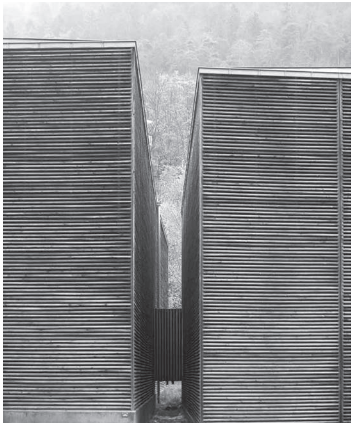
P. Zumthor, Coperture per gli scavi archeologici romani di Coira, 1985-86 , fotografia di M. Ferrari, 2004. Illustrazione dal volume Architettura e materia. Realtà della forma costruita nell'epoca dell'immateriale .