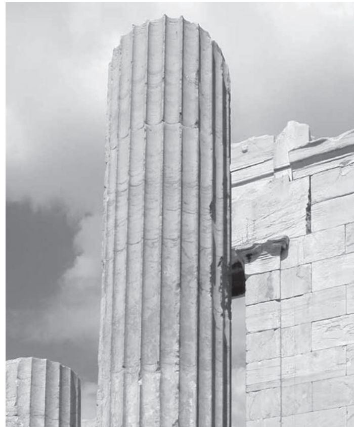
Acropoli di Atene, Propilei, V secolo a.C. , fotografia di M. Ferrari, 2009. Illustrazione dal volume Architettura e materia. Realtà della forma costruita nell'epoca dell'immateriale .