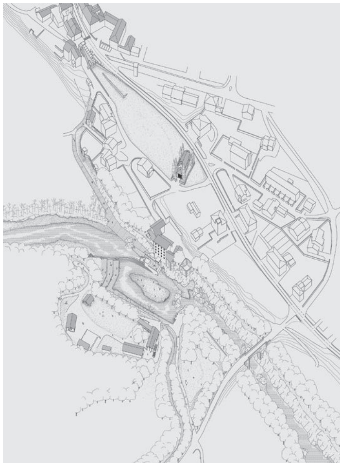
A. Iorio, Progetto di ripristino della briglia di Vernasso, realizzazione di una centralina idroelettrica, sistemazione del lungofiume e dei percorsi da S. Pietro al Natissone , 2020. Illustrazione dal volume Parco transfrontaliero del Natissone. Studio e progetti .