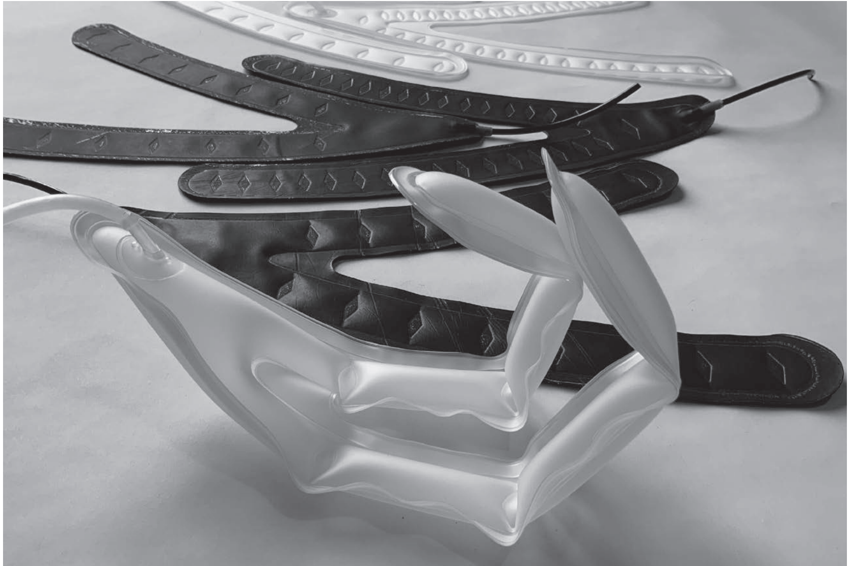
A. Buffagni, Attuatori soft: prototipi di studio , fotografia di A. Buffagni, 2021. Illustrazione dal volume Modellare la tecnologia sul corpo che invecchia. La ricerca di un metodo .