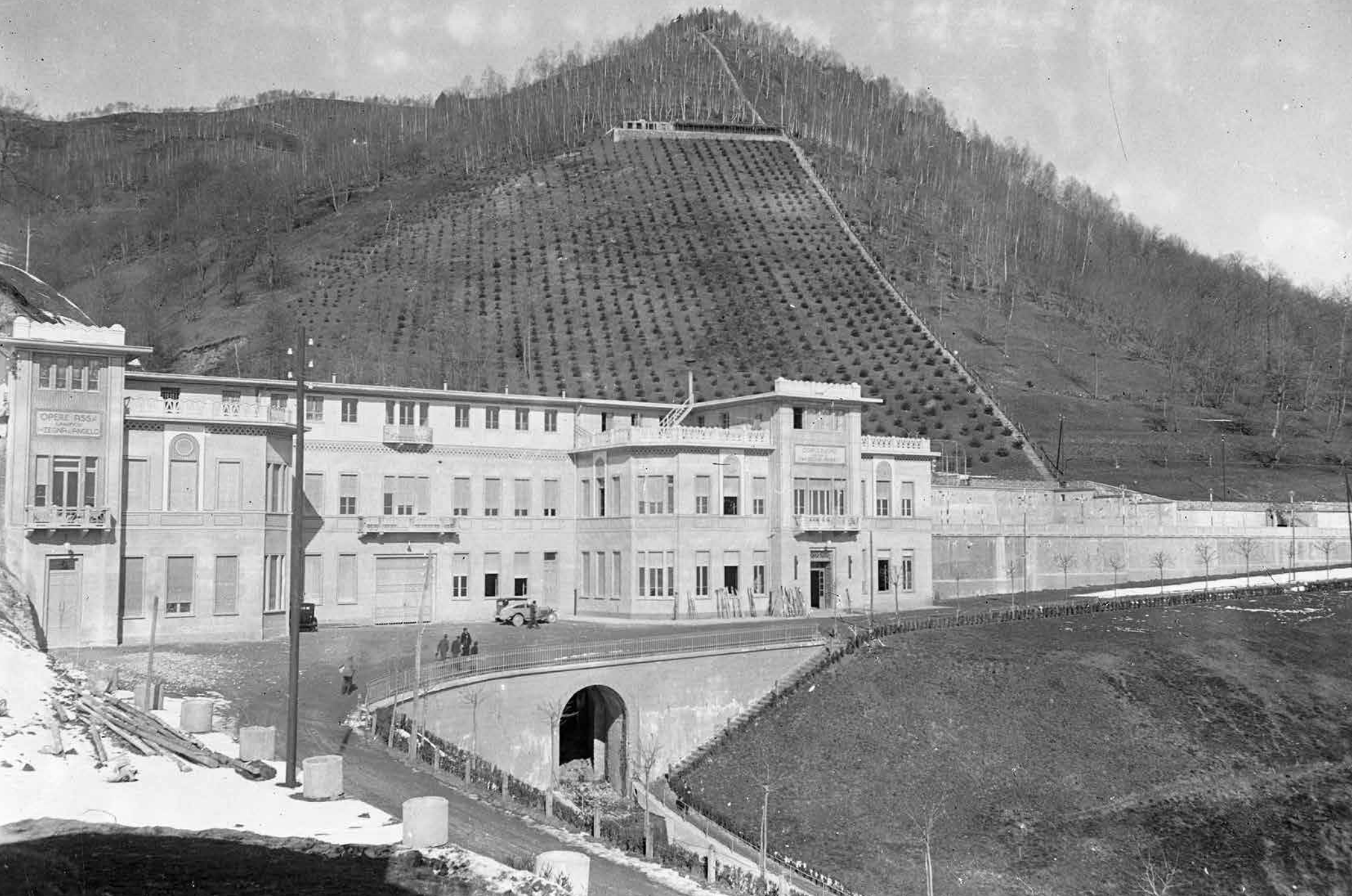
Veduta del dopolavoro del lanificio F.lli Zegna di Angelo, anni Trenta, fotografia di Rodolfo Mazzeranghi. © Fondazione Ermenegildo Zegna – archivi.