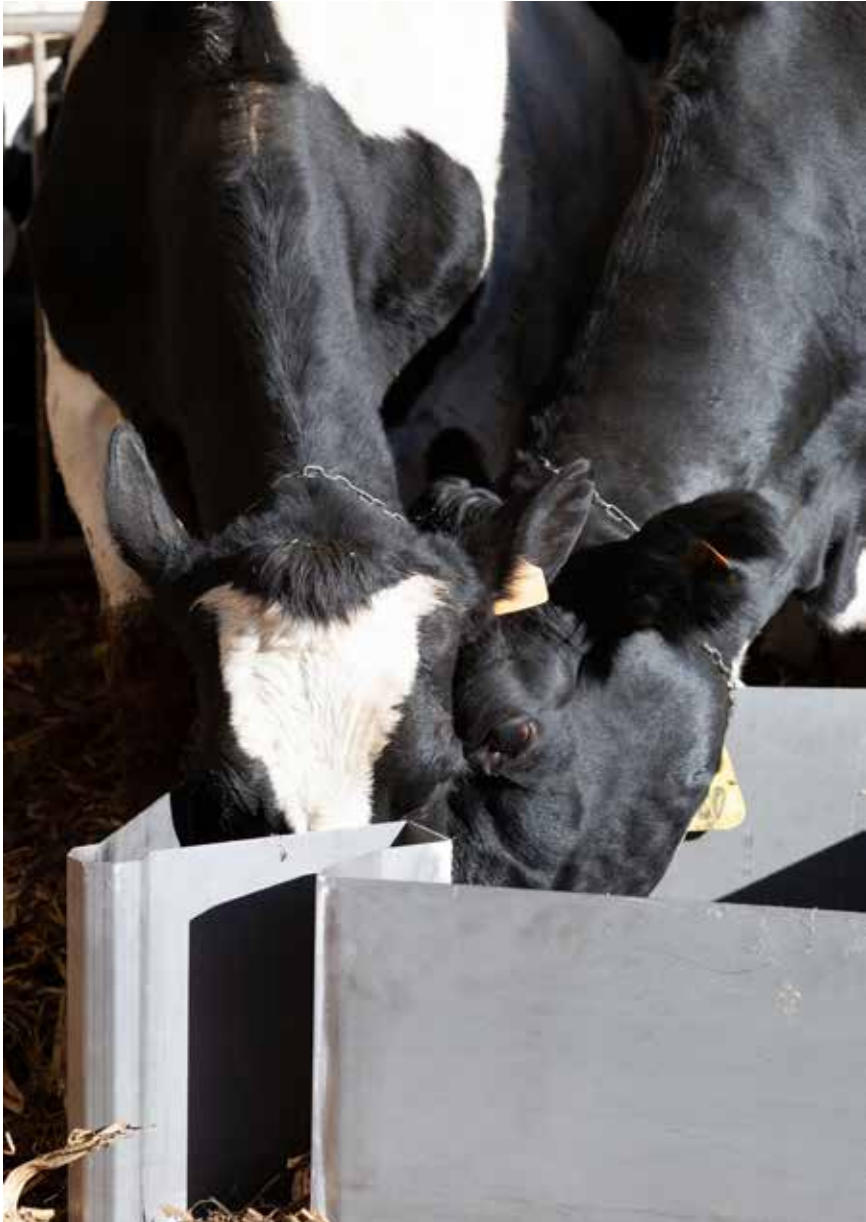
Crudo e mangiato , Lodetto (BS). Fotografia di Sissi Cesira Roselli, 2022. Modello dell'isola in lamiera decapata 30/10 S235JR, 950mm x 1100mm. Si ringrazia l'allevamento di Marco Corna.