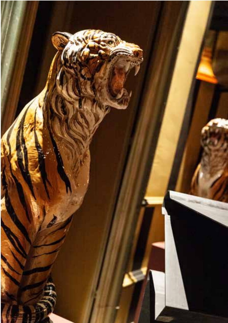
Crudo e mangiato , Brescia. Fotografia di Sissi Cesira Roselli, 2022. Modello dell'isola in lamiera decapata 30/10 S235JR, 950mm x 1100mm. Si ringrazia Veleno Ristorante & Pasticceria.