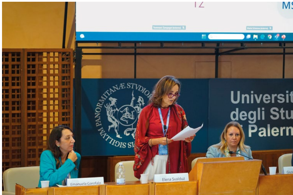
1-2: Cerimonia di apertura del Congresso presso la Sala Magna del palazzo Chiaromonte (Steri), sede del Rettorato dell'Università degli Studi di Palermo, 10 settembre 2025. Opening ceremony of the Congress in the Sala Magna of Palazzo Chiaromonte (Steri), the seat of the Rectorate of the University of Palermo, September 10, 2025.