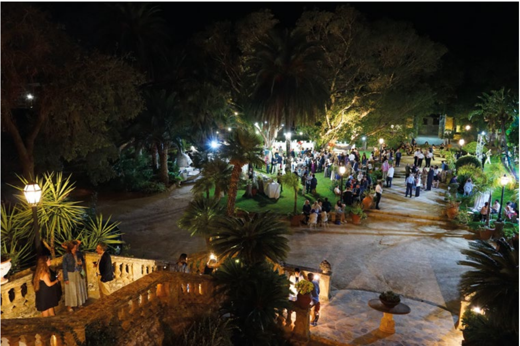
7-8: Cena di Gala a villa Boscogrande, 12 settembre 2025. Gala Dinner at villa Boscogrande, September 12, 2025.