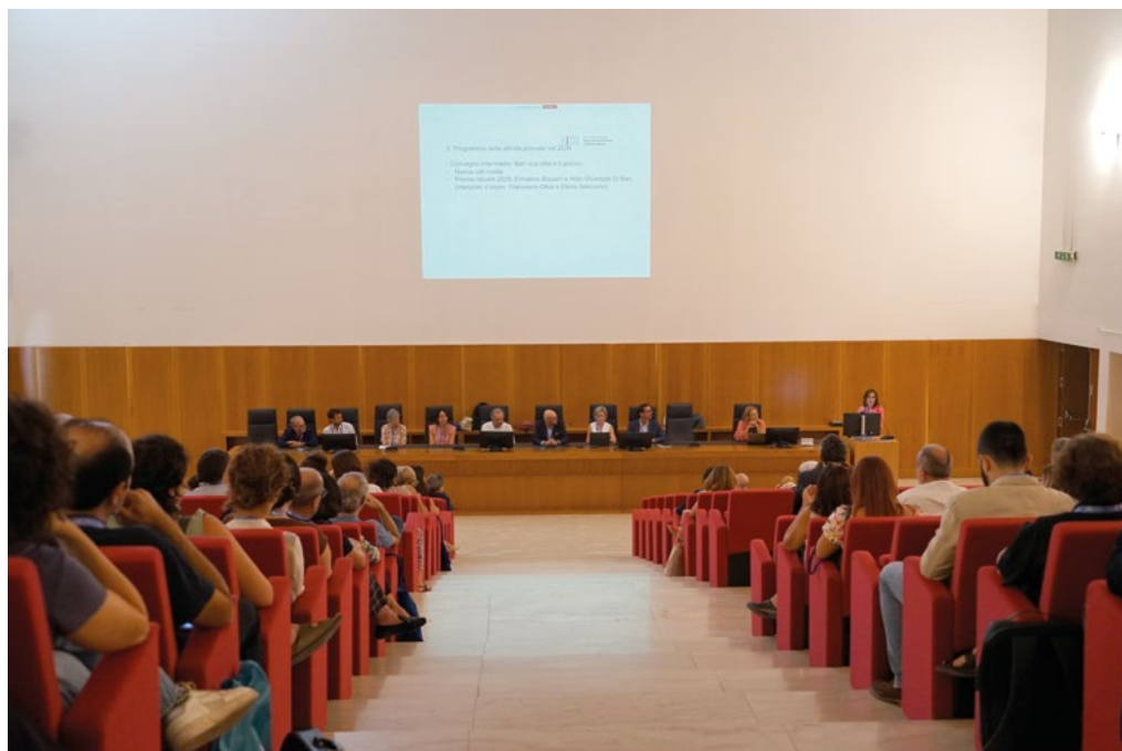
9-10: Assemblea dei soci AISU e cerimonia conclusiva del Congresso presso l'Aula Magna "Margherita De Simone" del Dipartimento di Architettura dell'Università degli Studi di Palermo, 12 e 13 settembre 2025. AISU Members' Meeting and closing ceremony of the Congress at the "Margherita De Simone" Lecture Hall of the Department of Architecture of the University of Palermo, September 12 and 13, 2025.