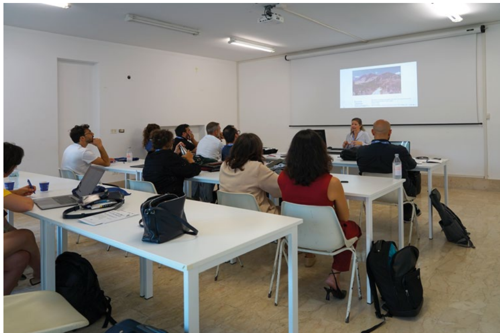
5-6: Presentazioni nelle sessioni del Congresso presso il Dipartimento di Architettura dell'Università degli Studi di Palermo, 11 e 12 settembre 2025. Presentations in the Congress sessions at the Department of Architecture of the University of Palermo, September 11 and 12, 2025.