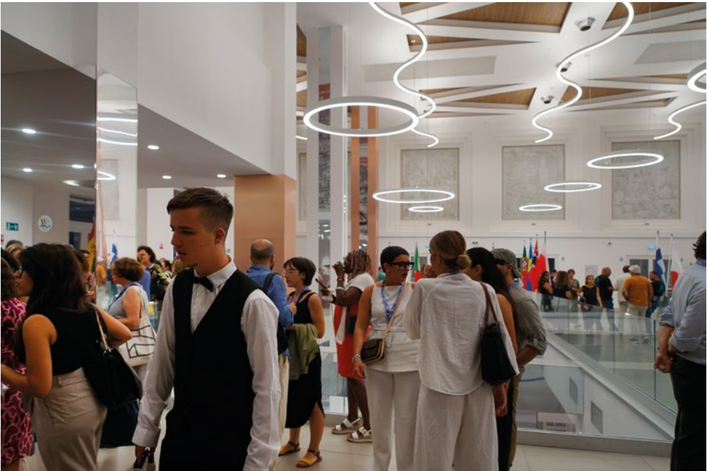
3-4: Libri all'AIU e aperitivo di benvenuto presso il Terminal Cruise Palermo, porto di Palermo, molo Vittorio Veneto, 10 settembre 2025. Books presentations at AIU and welcome cocktail at the Palermo Cruise Terminal, Port of Palermo, Vittorio Veneto Pier, September 10, 2025.