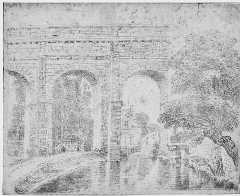
fig. 1 : Antoine Watteau, Un aqueduc (Arcueil ?) , c. 1714, sanguine, 14,7 x 18 cm, Valenciennes, Musée des Beaux-Arts, inv. 76-23

monument ancien et architecture moderne coexistent. En général, dans plusieurs feuilles conservées, Watteau a dessiné les environs parisiens du point de vue délibérément partiel du flâneur 24 . Une eau-forte connue par son inclusion dans le premier volume du recueil des Figures de différents caractères, de Paysages, et d'Études dessinées d'après nature par Antoine Watteau (1726), montre la Bièvre dans son passage à côté des Gobelins (fig. 2) 25 . Comme le signale l'intitulé du recueil, les paysages dessinés, comme les portraits, valident leur statut de vues d'après nature par un style libre et par leur iconographie. En ce sens, la représentation de la manufacture royale – que Watteau a certainement fréquentée pendant quelques années – par ses murs extérieurs, marque l'origine temporelle et géographique de ce regard sophistiqué sur les environs