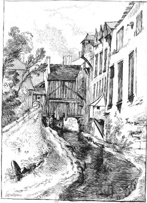
fig. 2 : Antoine Watteau, Planche 23 des Figures des Différents caractères . La Bièvre aux Gobelins , eau-forte, 25,2 x 18,1 cm, Paris, Bibliothèque numérique de l'INHA, NUM PL EST 96 (1)

immédiats de la ville, que Jean de Jullienne a voulu promouvoir comme un regard propre à l'artiste 26 .