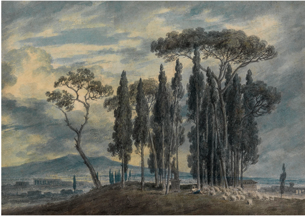
fig. 5 : John Robert Cozens, In the Gardens of the villa Negroni at Rome , 1783, aquarelle, 26,1 x 37,1 cm, Londres, collection privée