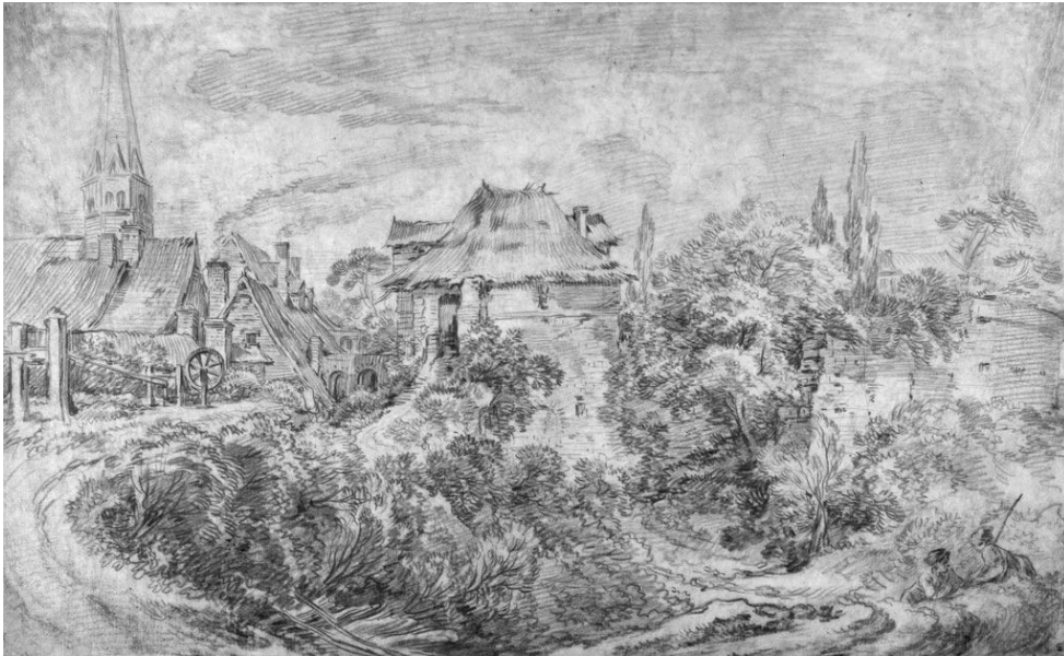
fig.4 : François Boucher, Paysage rural et bergers , c. 1726-1728, sanguine sur parchemin, 30,5 x 49,2 cm, Los Angeles, Getty Museum, 83.GB.200

un exercice pour la main, mais aussi une matrice du regard sur le paysage réel. Vers la fin des années 1720, François Boucher – qui avait gravé tous les dessins de paysage de Watteau – traduira le langage idéalisant des Vénitiens dans une vue des environs d'un village nordique (fig. 4) 37 . Dessiné à la sanguine sur un support précieux de parchemin, ce dessin annonce le succès des environs parisiens comme sujet pour des dessins très finis vers la moitié du siècle. Le support, le format, et les indications visuelles et textuelles qui accompagnent les dessins des environs sont des dispositifs qui visent donc à augmenter l'effet de réalité des feuilles d'une manière de plus en plus standardisée.