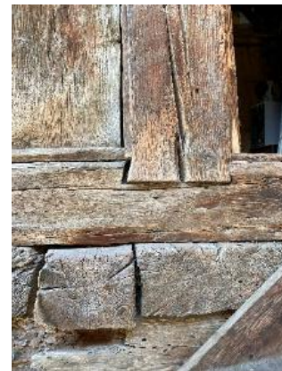
6: Permanenze, uso e forme di resilienza, a sinistra il fienile di Casa “Alberti Minel” (M6) a Mortisa ancora ben conservato e in uso, a destra Toulà (M14), a Mortisa, dettagli costruttivi.