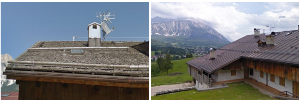
5: Trasformazioni, a sinistra un esempio a Ronco, casa "dei Pistoles - Mostaces" (R5), profondamente trasformata che riprende dalla tradizione un "finto" rivestimento in scandole applicato alla copertura contemporanea; a destra, a Cadin di Sopra, Casa Milar-Guarino-Caton (CA9) che mostra le recenti diffuse sostituzioni dei manti di copertura originari in scandole con lamiera metallica.