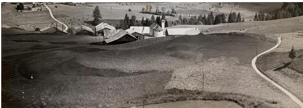
2: Cadin di Sotto visto da monte. Gli edifici storici quasi scompaiono nel pendio, lasciando visibili solo i triangoli fronti a nord in legno e delle coperture, inserendosi anche cromaticamente nel paesaggio.

Si tratta di un patrimonio del tutto peculiare ed inimitabile, che assume una grande importanza sia ai fini dell'identità culturale, che dello sviluppo sociale, economico e territoriale dell'intero comprensorio.