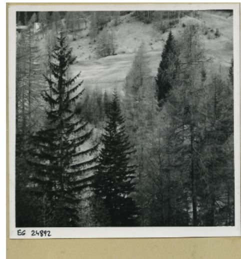
1: Fioritura dei pascoli alti a Cortina e boschi presso Cadin, nelle immagini di Edoardo Gellner, a testimoniare gli elementi caratterizzanti il paesaggio e base delle risorse economiche del contesto originario. [Università Iuav di Venezia - Archivio Progetti - Fondo Edoardo Gellner].

Nell'ambito di questo sistema fisico si colloca l'insediamento antropico che, nel corso dei secoli, ha raggiunto forme di equilibrio particolarmente significative e legate al linguaggio e alla tradizione storica della montagna. Gli edifici tradizionali, i manufatti rurali e le numerose opere che si sono andate stratificando nel corso dei secoli hanno reso unici i paesaggi e gli insediamenti urbani (Fig. 2).