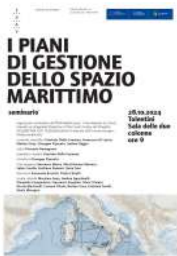
Seminario dedicato ai protagonisti dell'approvazione del PSM italiano (Decreto ministeriale n.237 del 25 settembre 2024).