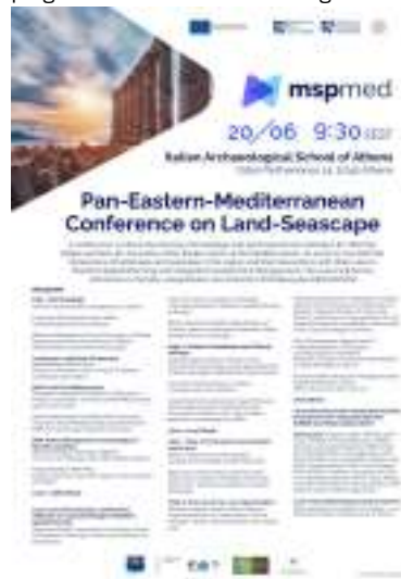
Conferenza internazionale MSP-Med delle regioni mediterranee orientali, con dibattito sul patrimonio culturale sommerso (UCH).