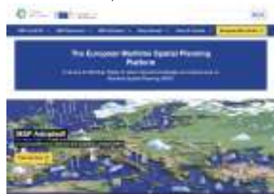
Il portale europeo per la Pianificazione Spaziale marittima che riporta la notizia dell'approvazione del Piano italiano.