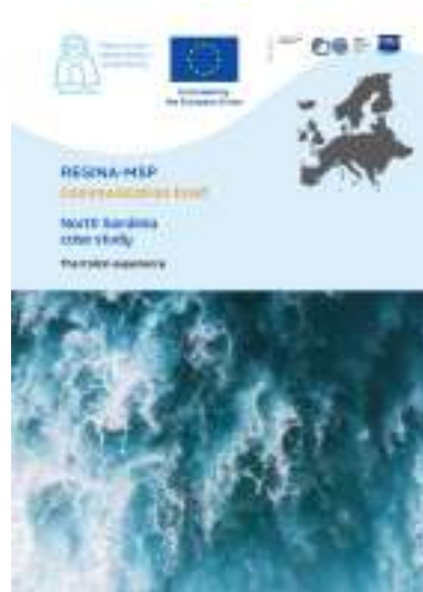
Partecipazione dell’Italia con l’analisi della Regione Sardegna al convegno per il progetto internazionale MSP-Regina.

A livello regionale, sono state sviluppate misure specifiche, tra cui linee guida per la progettazione di interventi volti alla