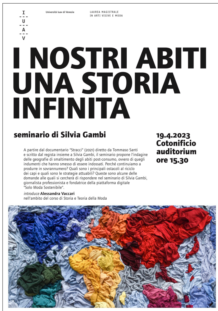
Figura 4: Locandina del seminario di Silvia Gambi, Università IUAV di Venezia, 19 aprile 2023.

invece che “moda”. 86 Sebbene questa critica alla moda non possa essere oggetto di approfondimento in questa sede, vale la pena sottolineare come alcune studentesse partecipanti al corso abbiano percepito come centrale questo punto. Per esempio una studentessa 87 ha riflettuto in questa prospettiva sul tema della griglia, mettendo in relazione i tracciati sartoriali e i cartamodelli editoriali (oggi spesso scaricabili online) a una rilettura del lavoro di attivismo progettuale di Superstudio negli anni Sessanta. 88