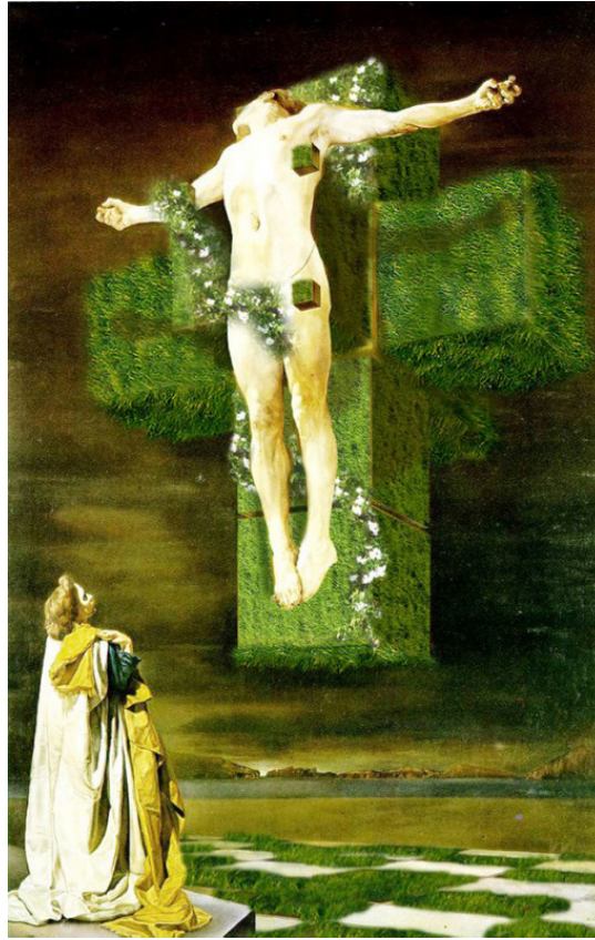
Fig. 2 B. Ramo, Sustainable Catholicism: Green Crucifixion (Corpus Hypercubus) – Dalí 1954.

“bonne couleur”). Faut-il qu’un paysage soit une vaste laitue, une soupe à l’oseille, un bouillon de nature ? 56 .