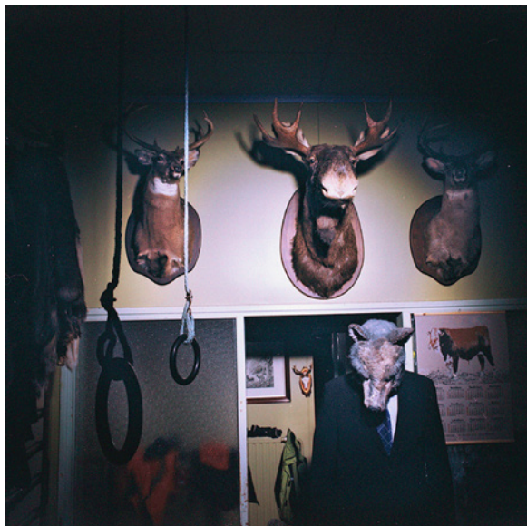
Figura 4: J. Kahilaniemi, Fictive Self-Portraits , 2012.