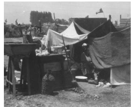
Imagen 4. El asentamiento durante los primeros días.