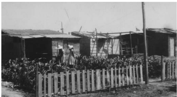
Imagen 8. La población después de unos meses (fuente: Sotomayor, 1958)