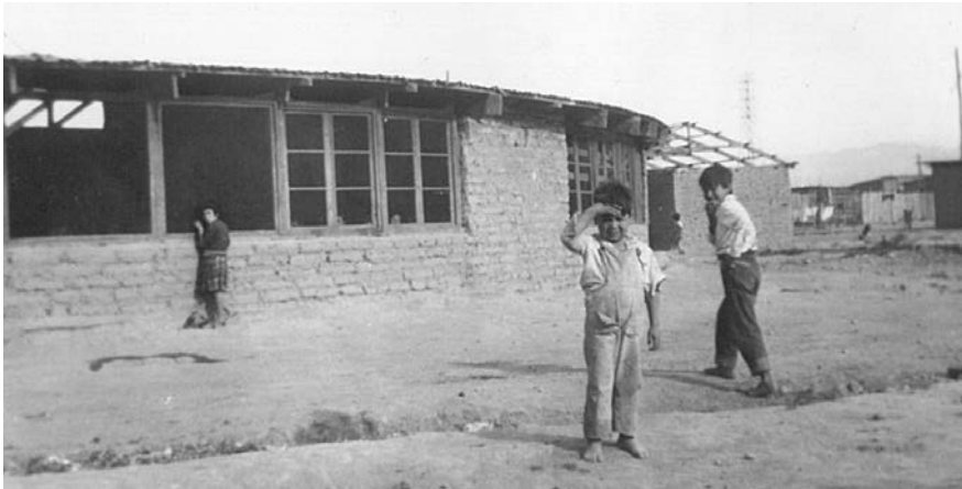
Imagen 11. La escuela redonda, construida por los pobladores.

estuvieron a la base tanto de las demandas de los pobladores, como de las políticas de vivienda para los sectores populares (Espinoza, 1988; Loyola, 1989; De Ramón, 1990; Garcés, 2002). El sitio propio se convirtió en la unidad fundamental del crecimiento de Santiago (Vergara y Palmer, 1990).