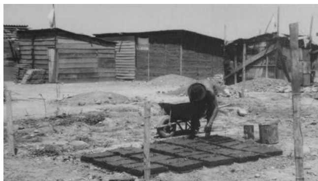
Imagen 9. Un poblador fabricando adobes

segundo recuperó una cierta relevancia en los años noventa, siendo el programa de pavimentación participativa uno de los episodios más significativo. Sin embargo, la vuelta a la democracia no significó la desaparición de los conflictos. El proceso de renovación del Plan Regulador de Pedro Aguirre Cerda, comuna a la cual pertenece la Población La Victoria, generó un duro enfrentamiento entre el 2005 y el 2006. El plan fue encargado a una consultora, que elaboró una propuesta con una escasa participación ciudadana. Según la municipalidad, ésta habría creado plusvalías en beneficio de los habitantes. En cambio, los vecinos de la comuna, encabezados por los habitantes de La Victoria, se opusieron. Contestaron las expropiaciones necesarias para abrir nuevos espacios públicos y el incremento de los índices de constructibilidad, temiendo un proceso de expulsión producido por