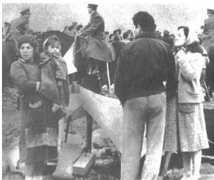
Imagen 3. La toma de La Victoria, 1957, enfrentamiento con los carabineros (fuente: Morales, s.f.).

La presencia al mismo tiempo de enfrentamiento y negociaciones evidencia una tensión entre un discurso de ruptura frente al Estado, que ha sido destacado por Cortés (2014), y la necesidad de establecer un diálogo con el mismo. Esta aparente contradicción puede ser explicada si se entiende la toma como una reivindicación de un derecho (Espinoza, 1998). La acción violenta permitió llegar a tal derecho, pero era necesaria una legitimación externa para que fuese efectivo. En este sentido, las tomas no eran actos desarrollados fuera de las instituciones, sino que eran dirigidas hacia ellas, para que fuese reconocido y concretado el derecho que se reclamaba. Algunos actores externos fueron esenciales en las negociaciones, aportando también ayuda material, asesoría técnica y capacidad organizativa. En todas las fases de la toma estuvieron presentes diputados de izquierda, el Hogar de Cristo, estudiantes y las autoridades de la Municipalidad. El apoyo de estos actores y de la opinión