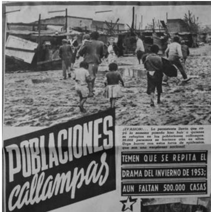
Imagen 1. Callampas en el Zanjón de la Aguada