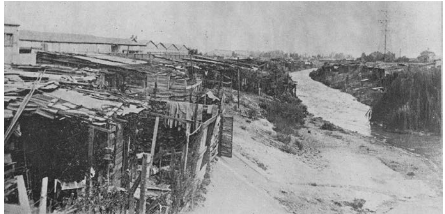
Imagen 2. Poblaciones callampas.