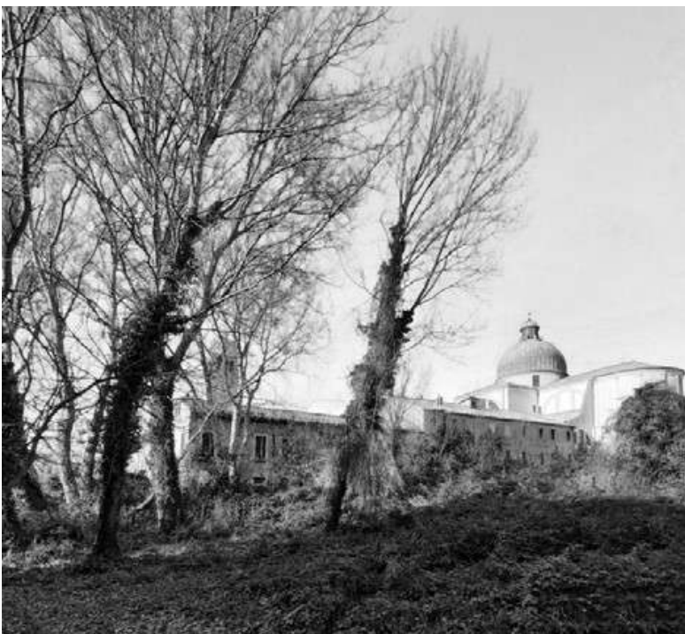
4: Veduta del Palazzo Patriarcale, dall'area naturale abbandonata ad est (foto di A. C. Ardila García).