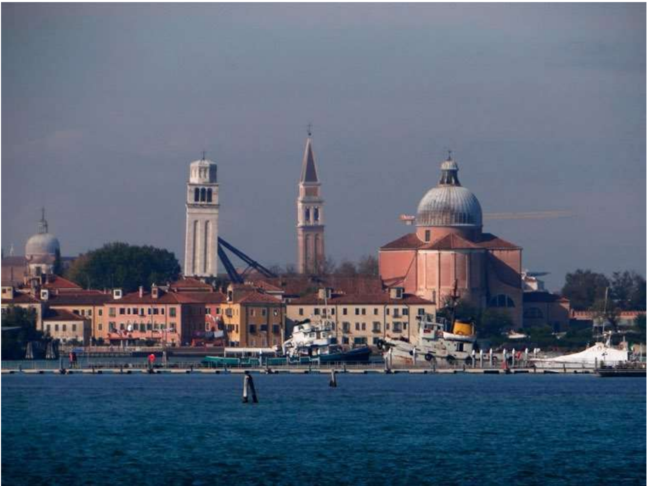
3: Veduta dell'Isola di San Pietro in Castello, dalla Riviera di San Nicolò. Da sinistra a destra: il quartiere novecentesco e il cantiere navale; in secondo piano, il campanile della basilica di San Pietro in Castello rifabbricato da Mauro Codussi tra il 1482 e il 1488; il campanile di San Francesco della Vigna (1543-1581); l'abside della Basilica di San Pietro.