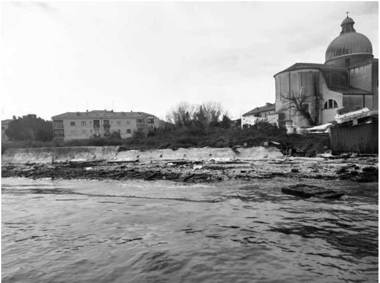
5: Veduta dell'Isola da est. In primo piano, i bunker con la zona boschiva alle spalle e gli edifici novecenteschi; sulla destra, l'abside di San Pietro.

dei giardini botanici, va rilevato il particolare ruolo urbano che essi rappresentano per i quartieri veneziani: spaccati di luce entro la penombra delle calli, polmoni necessari a far vivere gli edifici, nonché antidoti alla densificazione della città. Direzione da seguirsi anche con una meticolosa attenzione botanica, di cui è responsabile, in questo progetto, il prof. Leonardo Filesi. Si pianifica una strategia di connessione su tutta l'isola con ingresso attraverso una galleria ricavata da edificio artigianale che porta in camminata dal Ponte De Quintavale al centro della piazza. Il lungo pergolato, che si conclude con un pontile (consolidato nel bordo in continuità con la Fondamenta a Olivolo), rappresenta il filo conduttore di questo nuovo parco.