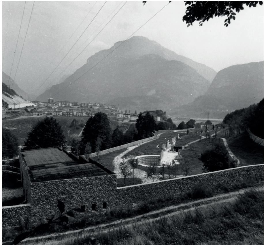
Fig. 4 Cimitero di Muda Maé, veduta dall'alto.

morality per passare da uno stato di attonita afflizione a uno stato creativo promosso da risorse spirituali anche irrazionali» (Canella 1974, p. 2).