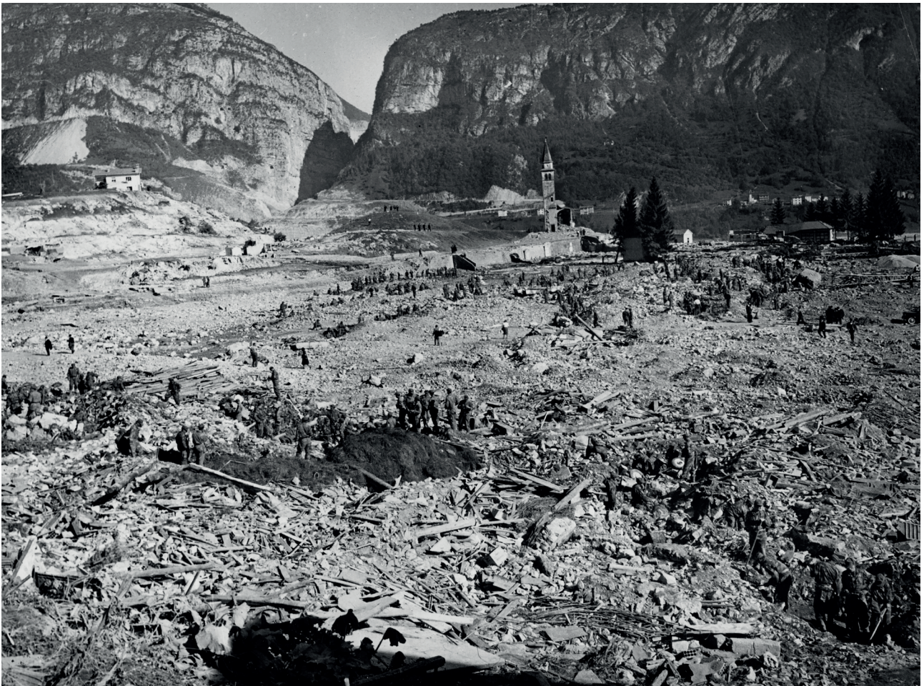
Fig. 1 La “tabula rasa” di Longarone dopo il disastro del Vajont (foto storica).

All’indomani della tragedia il piano e le opere di ricostruzione vengono affidati al gruppo di architetti capeggiato da Giuseppe Samonà che propose un intervento di matrice modernista per la Longarone ricostruita, dovendosi confrontare aspramente con le richieste diametralmente opposte del «comitato superstiti», i quali auspicavano una ricostruzione del tessuto urbano basata su modelli tradizionali, mossi più dalla volontà di riappropriarsi di quell’ambiente familiare che videro drammaticamente scomparire in pochi minuti piuttosto che dall’intenzione di attuare un’operazione di ripristino filologico dell’abitato.