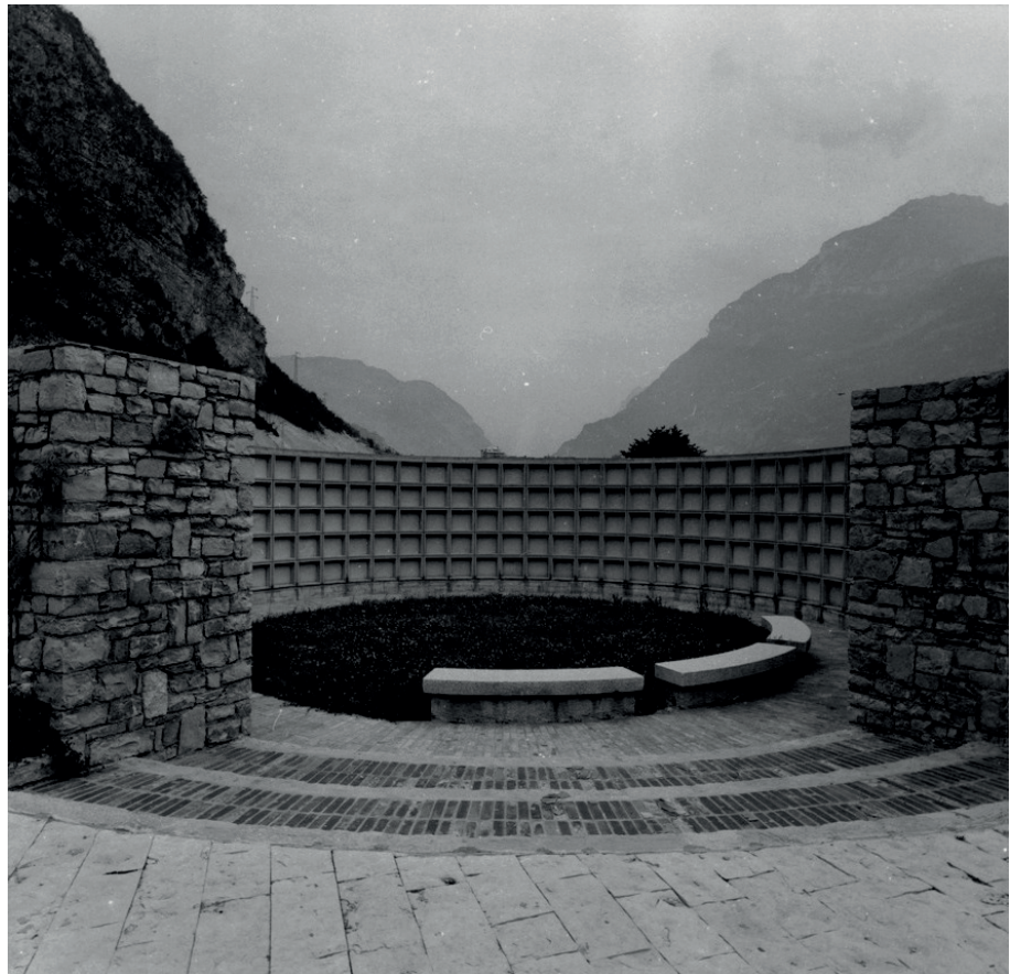
Fig. 5 Cimitero di Muda Maé, veduta dal percorso interno.

Il Cimitero di Muda Maé si eleva così, per sua stessa natura, a monumento in quanto luogo della memoria e della sua celebrazione: