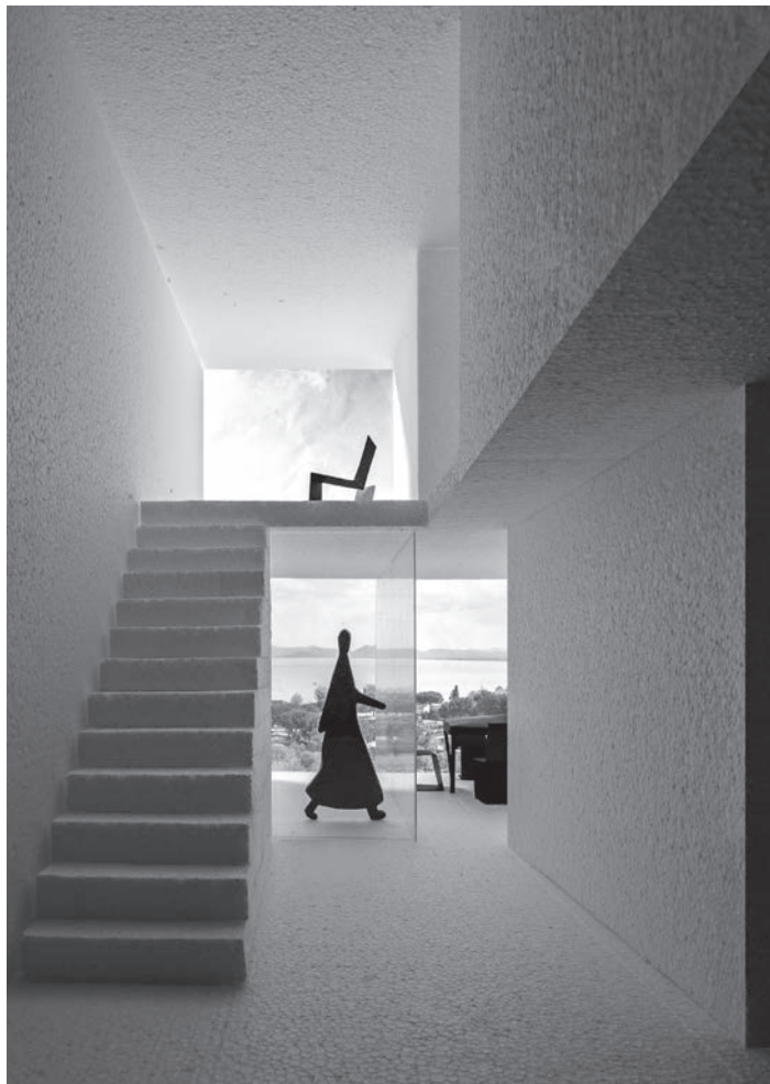
D. De Luca, Modello in scala 1:10 di uno spazio domestico , fotografia di U. Ferro, L. Pilot, 2019. Illustrazione dal volume Afferrare lo spazio. Dispositivi, pratiche e strumenti per un approccio tridimensionale al progetto di architettura .