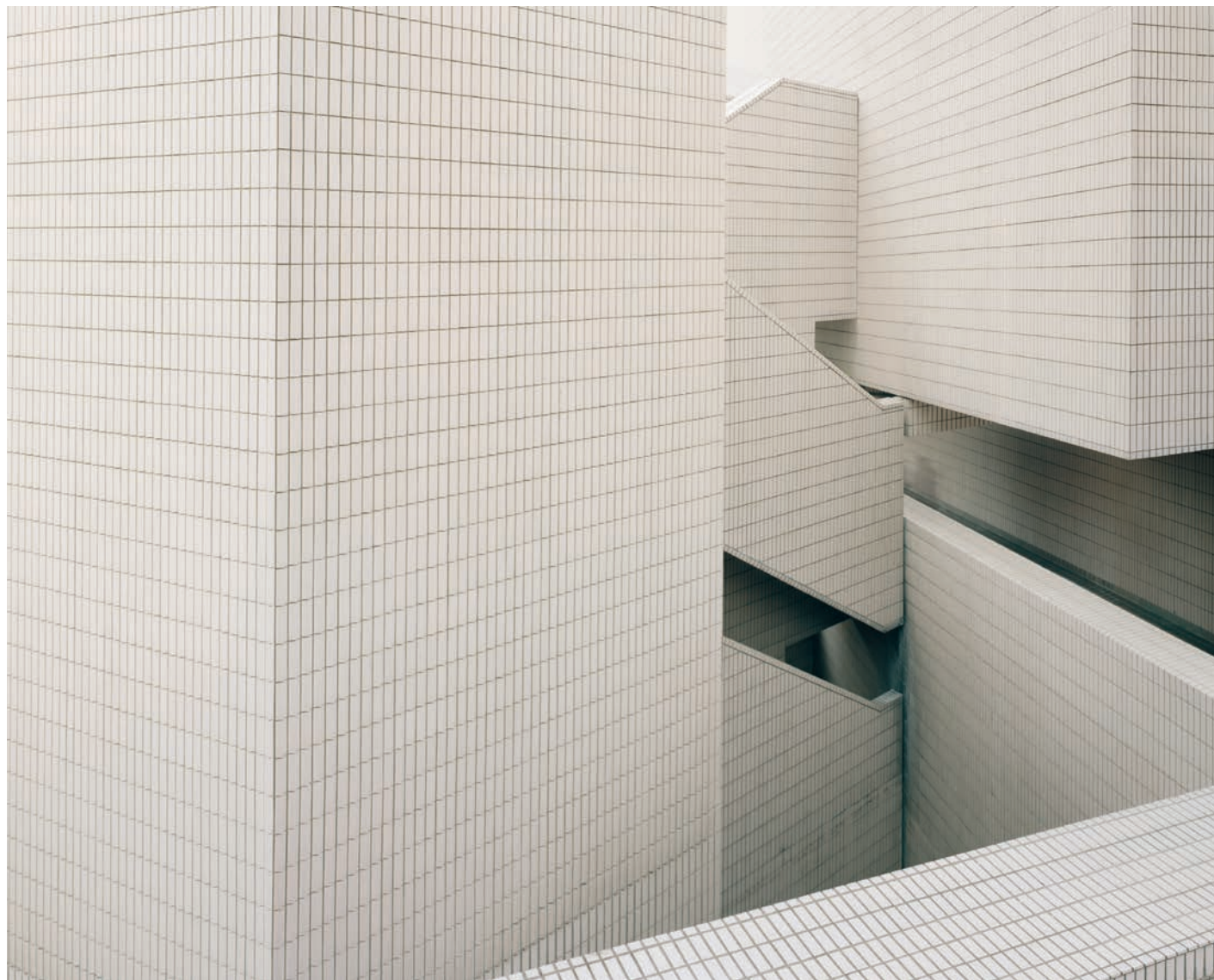
Alley (Skywalk), 2010.