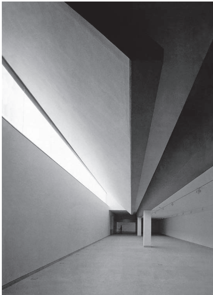
J. N. Baldeweg, Museo di Altamira e Centro di ricerca , Santillana del Mar, 2000. Illustrazione dal volume Between Sense of Time and Sense of Place. Designing heritage tourism .