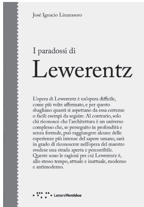
Copertina del volume I paradossi di Lewerentz (J. I. Linazasoro, 2023).