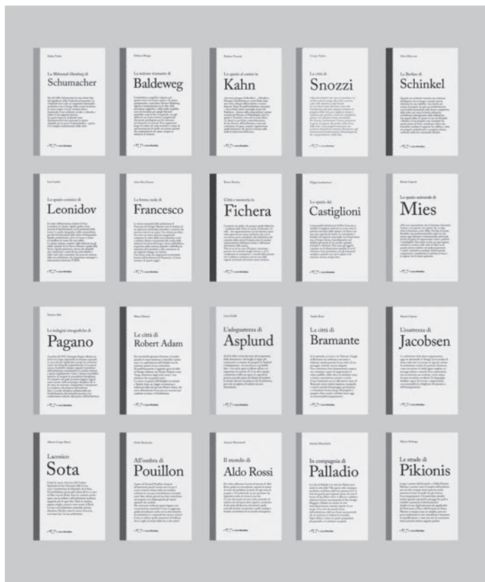
Copertine della Collana Figure .