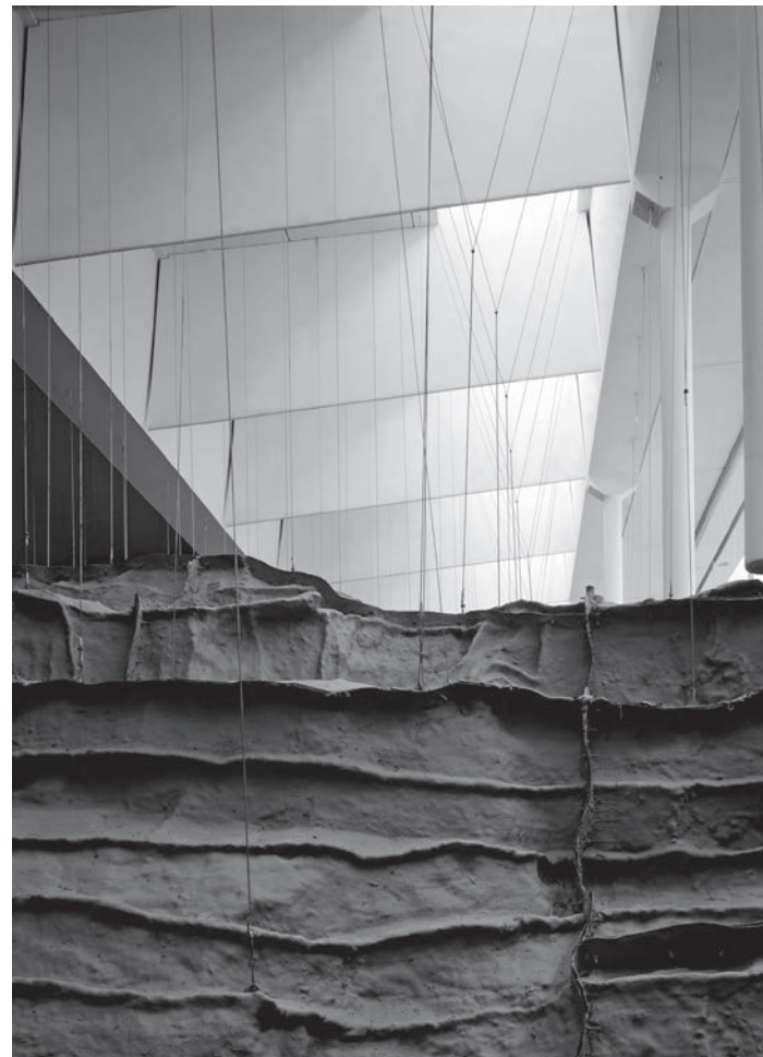
J. N. Baldeweg, Museo di Altamira e Centro di ricerca, Struttura sospesa della replica , Santillana del Mar, 2000. Courtesy of J. N. Baldeweg. Illustrazione dal volume Between Sense of Time and Sense of Place. Designing heritage tourism .