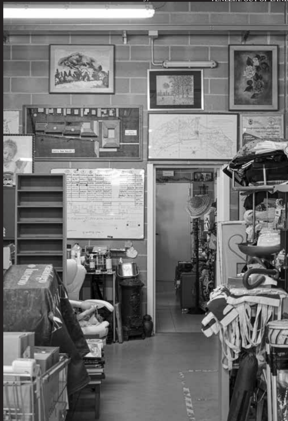
Qui e alle pagine seguenti: "Il monte di piet ", associazione "Il Prossimo" – Centro di solidariet  cristiana "Papa Francesco", Venezia Mestre, 2025.