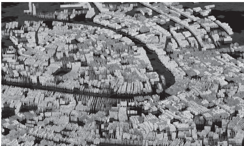
Fig. 3 - Vista assonometrica delle principali tecnologie costruttive veneziane rilevate a scala urbana: i piedritti o muri di spina, i pozzi e le cisterne sotterranee, i camini, le altane, in un unico disegno.

Urban map of the main Venetian construction technologies: piles/spine walls, wells/cisterns, chimneys, altanas, etc., distributed throughout the city. This map shows the widespread use of these devices, highlighting their function in mapping proactive construction strategies.