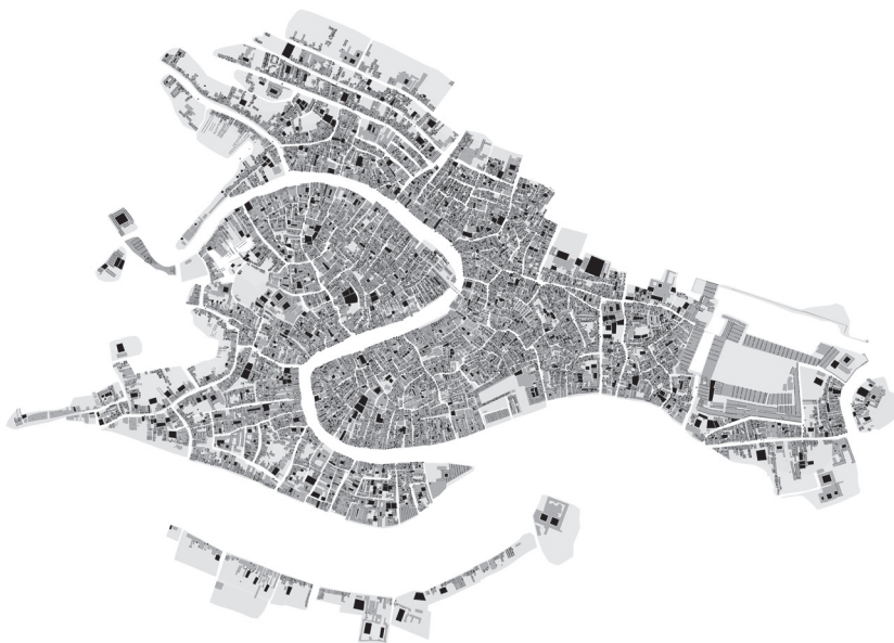
Fig. 2 - Mappa urbana delle principali tecnologie costruttive veneziane: pali/muri di spina, pozzi/cisterne, camini, altane, ecc., distribuite nel tessuto cittadino. Tale cartografia visualizza la diffusione capillare di questi dispositivi, evidenziandone la funzione di mappatura delle strategie costruttive proattive.

Urban map of the main Venetian construction technologies: piles/spine walls, wells/cisterns, chimneys, altanas, etc., distributed throughout the city. This map shows the widespread use of these devices, highlighting their function in mapping proactive construction strategies.