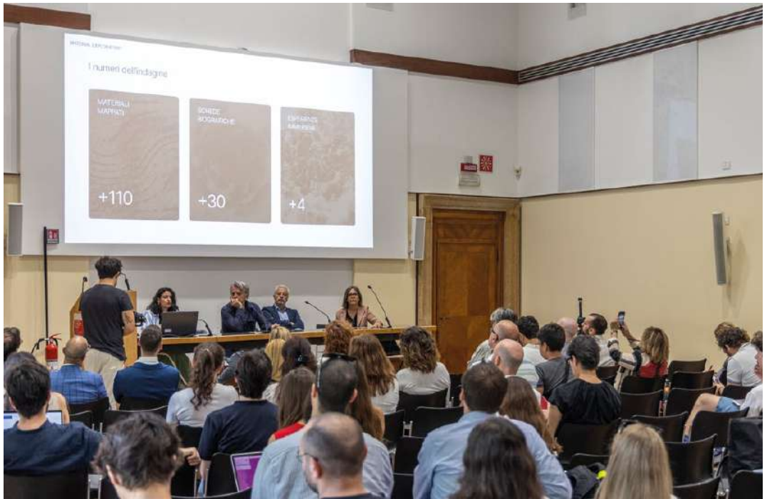
FIGURE 02, 03

Due momenti di restituzione pubblica dei risultati del progetto Material Exploratory, nell'aula Tafuri di palazzo Badoer.