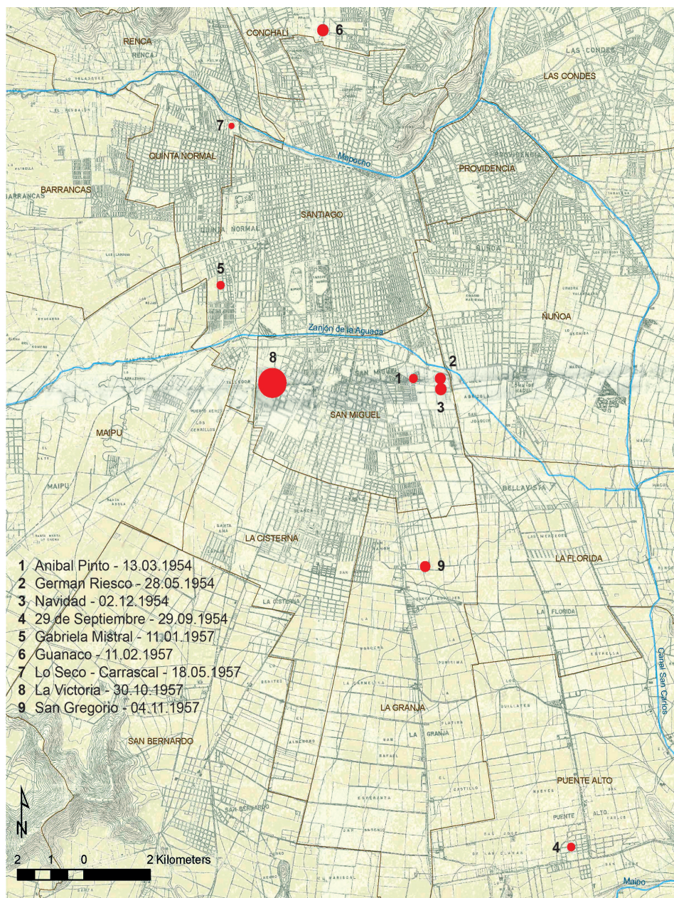
FIGURA 3 Ocupaciones realizadas en Santiago, entre 1954 y 1957