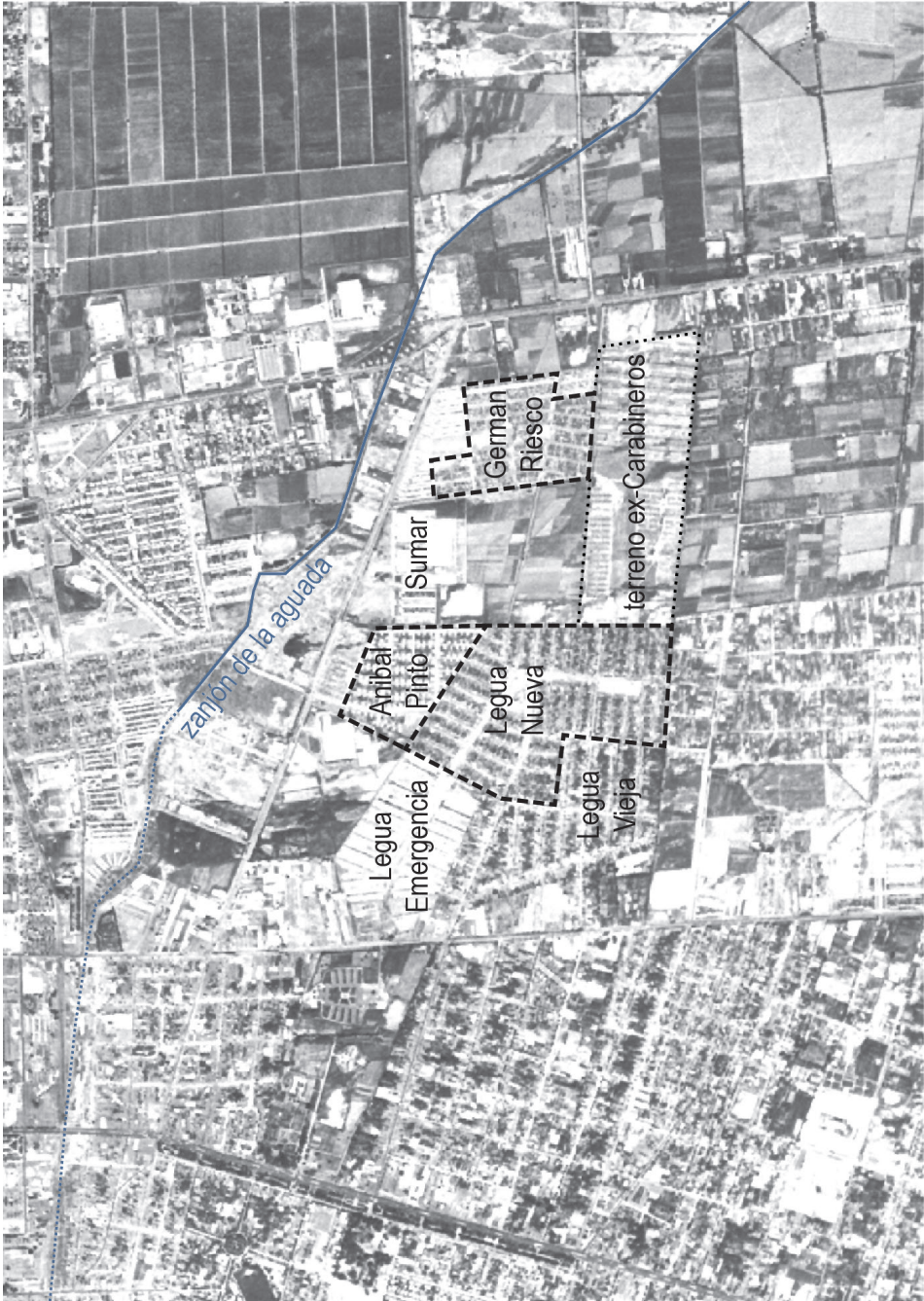
FIGURA 2 Sector noroeste de la comuna de San Miguel, a final de 1954