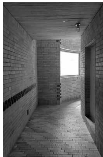
Fig. 3. Los pasillos, con los elaborados detalles de mampostería, incitan al descubrimiento y la sorpresa.

En 1948 Salmona emigró a París: el homicidio de Jorge Eliécer Gaitán había desencadenado un período de inestabilidad social en Bogotá. Fue acogido en el estudio de la Rue de Sèvres de Le Corbusier 12 , donde trabajó junto a Iannis Xenakis y Germán Samper, entre otros. En paralelo, Salmona comenzó a frecuentar las clases de Sociología del Arte de Pierre Francastel en la Sorbona. Rápidamente, la fascinación por el maestro suizo sería reemplazada por la del historiador del arte.