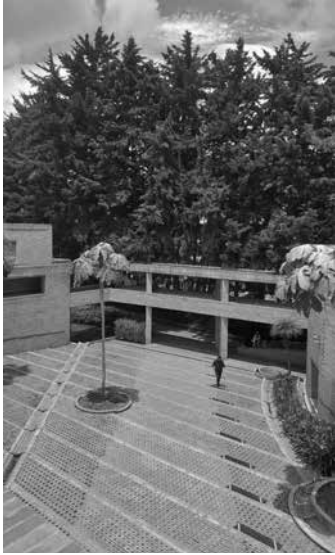
Fig. 2. El primer patio, el ingreso en diagonal acompañado por las atarjeas.

3. El uso del eje diagonal en espacios abiertos de geometrías simples es uno de los elementos más característicos de la composición del espacio en Salmona. En arquitecturas residenciales, como en la Casa Franco (1978) o la Casa Río Frío (1997), un eje diagonal atraviesa la regularidad del patio. En sus proyectos públicos, como el Centro Cultural Jorge Eliécer Gaitán (1975) o el Museo del Oro Quimbaya (1984), los patios están conectados a través de una diagonal, organización que Salmona llama "en batería".