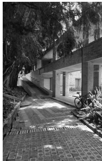
Fig. 1. El sendero inicial se bifurca anticipando el recorrido errante.

Acercándose al edificio, se percibe en primera instancia un gran jardín poblado por estudiantes, donde se lee al fondo la figura de la sala semicircular de la biblioteca, rodeada por un foso de agua que la resguarda, impidiendo el