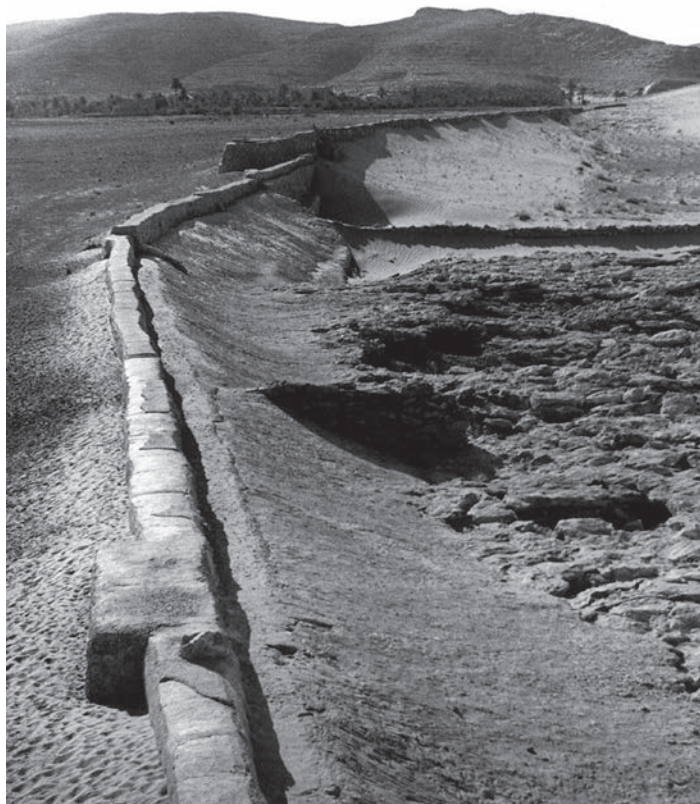
Diga a Beni Isguen, fotografia di M. Roche, © Manuelle Roche/ADAGP. Paris, 2013. Illustrazione dal volume Tra Mediterraneo e Sahara. André Ravéreau e la valle del M'Zab.