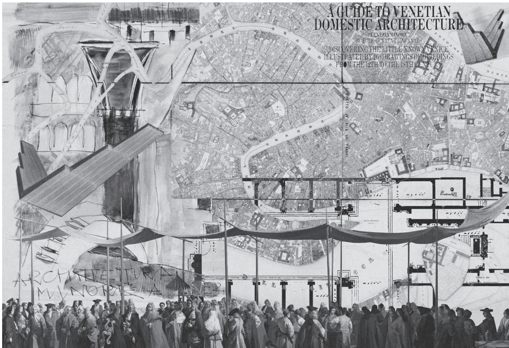
A. V. Mosetti, G. Conti, Figure di ritualistica veneziana , montaggio digitale, 2024. Illustrazione dal volume Architettura e Storia. Un incontro polifonico con Carlo Ginzburg | Architecture and History. A Polyphonic Encounter with Carlo Ginzburg .