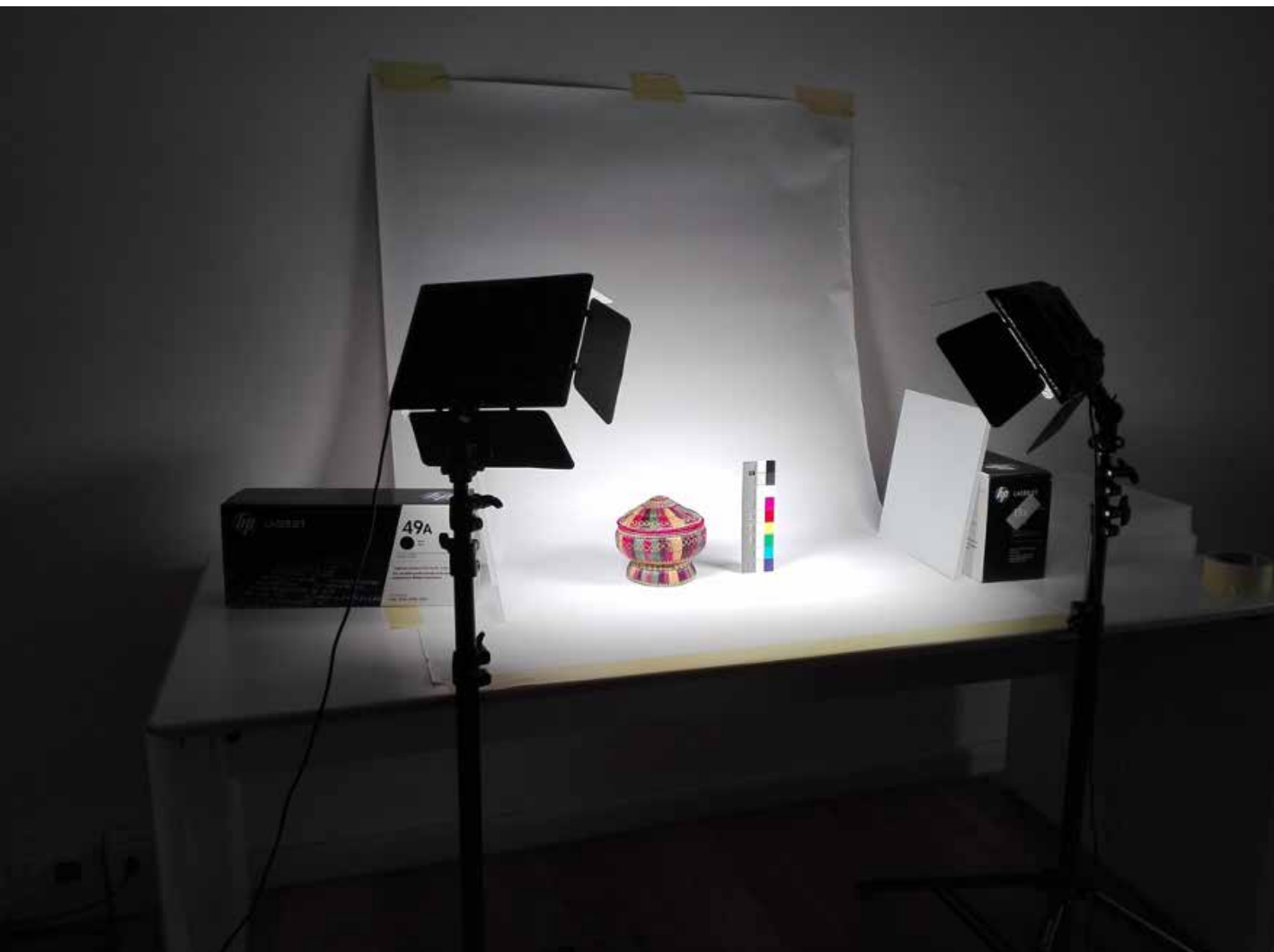
fig.1 Dossier dell'archivio di Ettore Sottsass jr. donato alla Fondazione Giorgio Cini di Venezia nel 2018. Foto di Noemi La Pera. Courtesy: Centro ARCHiVe, Fondazione Giorgio Cini onlus, Venezia. fig.2 Operazioni di digitalizzazione dei materiali dell'archivio di Ettore Sottsass jr. al Centro ARCHiVe della Fondazione Giorgio Cini. Foto di Noemi La Pera. Courtesy: Centro ARCHiVe, Fondazione Giorgio Cini onlus, Venezia.