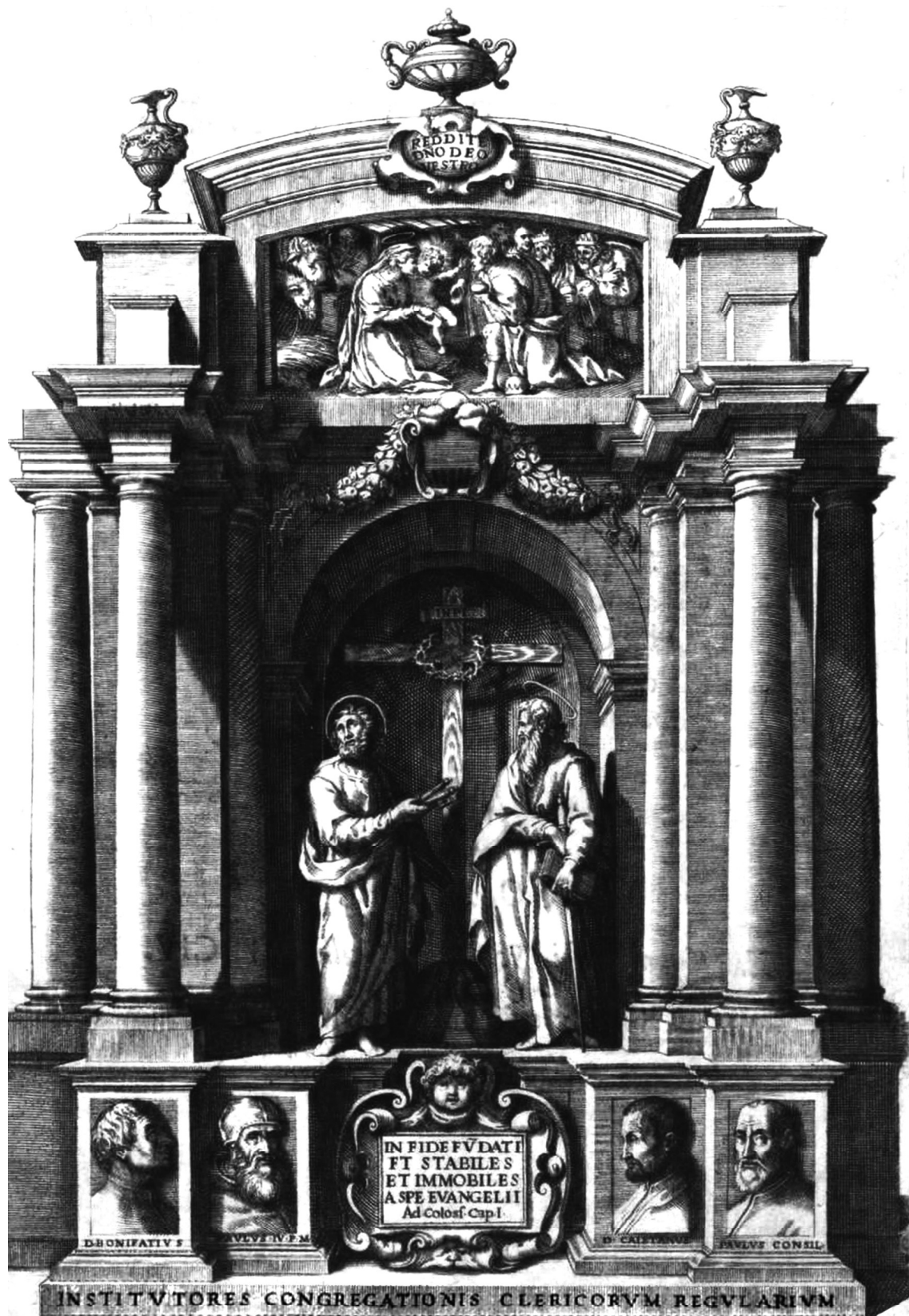
Fig. 1. Constitutiones Congregationis Clericorum Regularium, Romae, Ex. Tip. Stephani Paulini, 1604, antiporta, BNCR, 14.25.N.11.