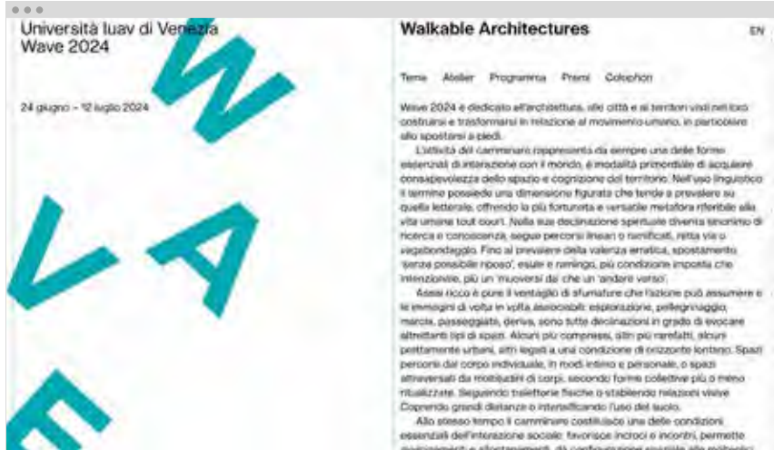
Sito web / Website