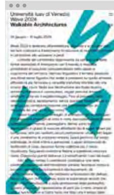
Design Damiano Fraccaro Sviluppo / Development Irene Sgarro