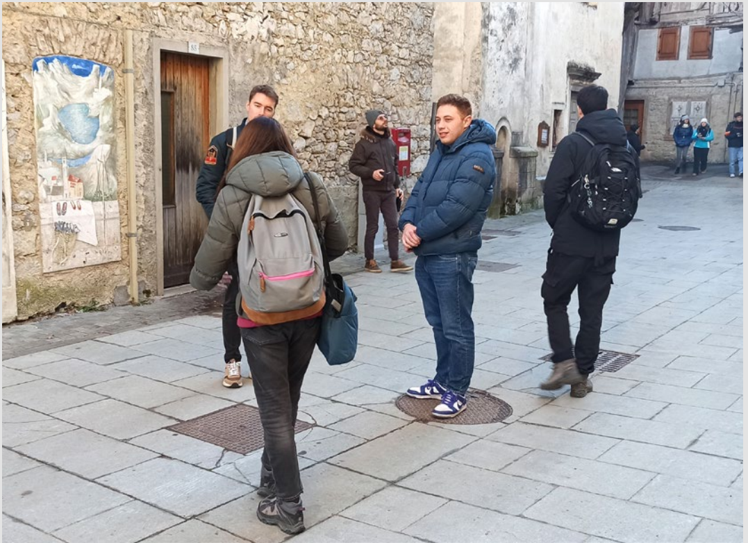
Sopralluogo presso il Borgo di Cibiana di Cadore durante l'iniziativa "Abitare la montagna". S. Marini, dicembre 2024.