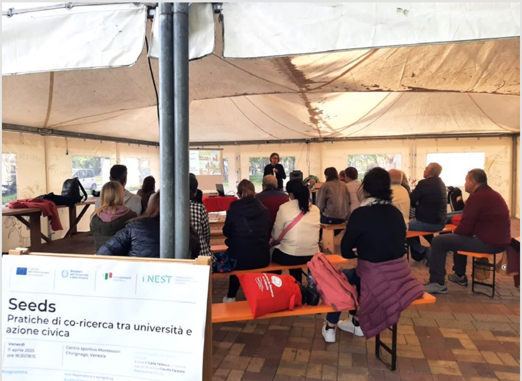
Presentazione iniziale durante l'iniziativa "Seeds. Pratiche di co-ricerca tra università e azione civica" presso il centro sportivo Montessori. E. Marchi, aprile 2025.