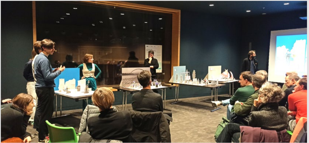
Presentazione iniziale dei diorami e dei progetti degli studenti prima del design sprint con i partecipanti all'iniziativa "La Velocità. Local Turbo Biking". S. Marini, novembre 2024.