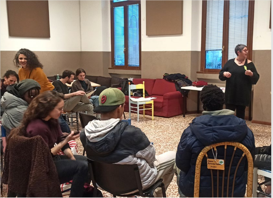
Laboratorio di mappatura partecipativa durante l'iniziativa "Rigenerazione urbana su base multiculturale all'Arcella". S. Marini, febbraio 2025.