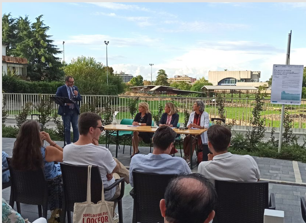
Introduzione del Sindaco di Montegrotto Terme all'iniziativa "Tra antico e nuovo". S. Marini, settembre 2025.