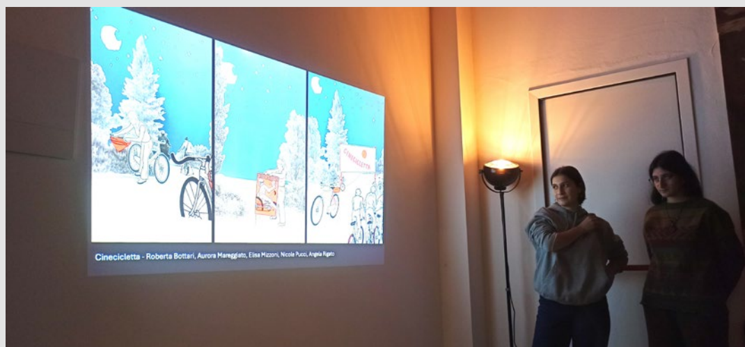
Presentazione dei progetti degli studenti durante l'iniziativa "La Velocità. Local Turbo Biking". S. Marini, novembre 2024.