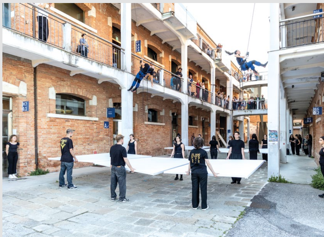
Iniziativa "Bodies in/through space". giugno 2024.