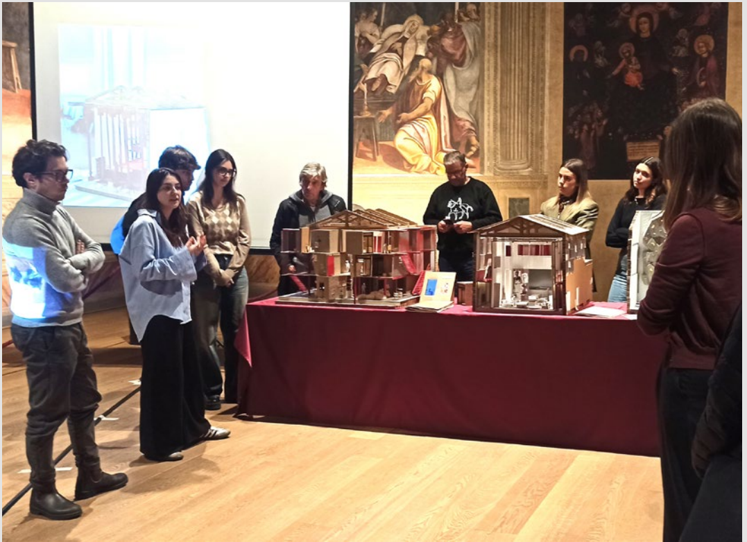
Presentazione dei progetti degli studenti alla cittadinanza durante l'iniziativa "Microfestival dell'Abitare preview!". S. Marini, marzo 2025.