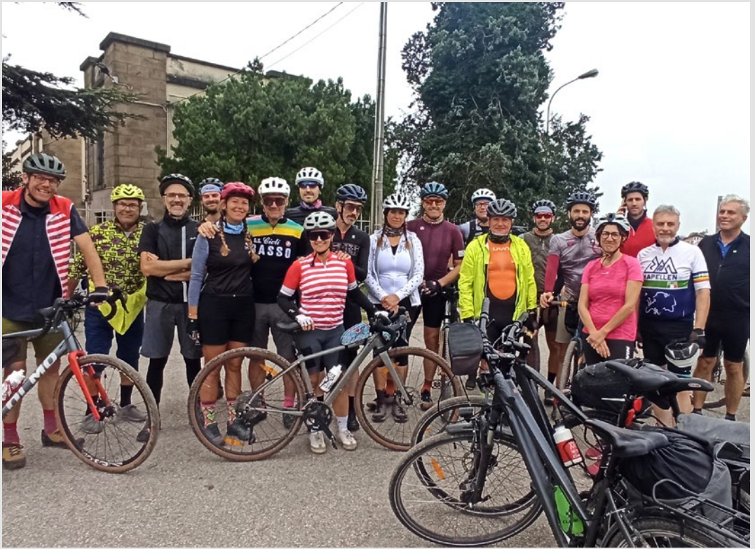
Foto di gruppo dei partecipanti all'iniziativa "MiAMI del Professore". S. Marini, ottobre 2024.