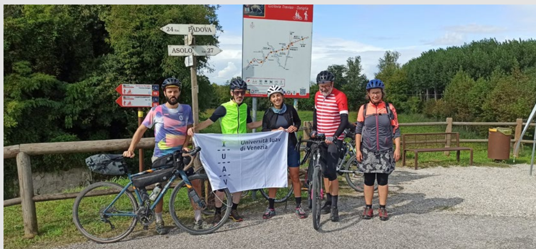
Partecipanti alla seconda giornata dell'iniziativa "Pedalando tra le stelle del futuro. iNEST in tour tra i territori dell'innovazione". S. Marini, settembre 2025.