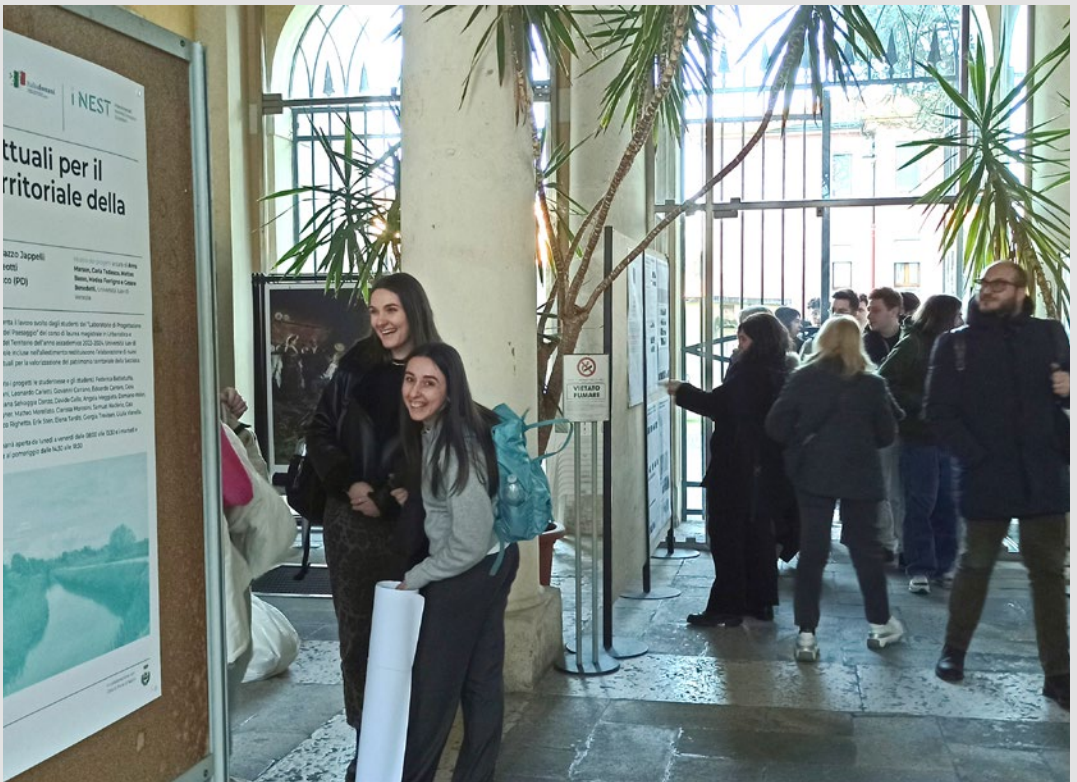
Inaugurazione dell'esposizione realizzata in occasione dell'iniziativa "Scenari progettuali per il patrimonio territoriale della Saccisica", presso Palazzo Jappelli a Pieve di Sacco. S. Marini, marzo 2025.