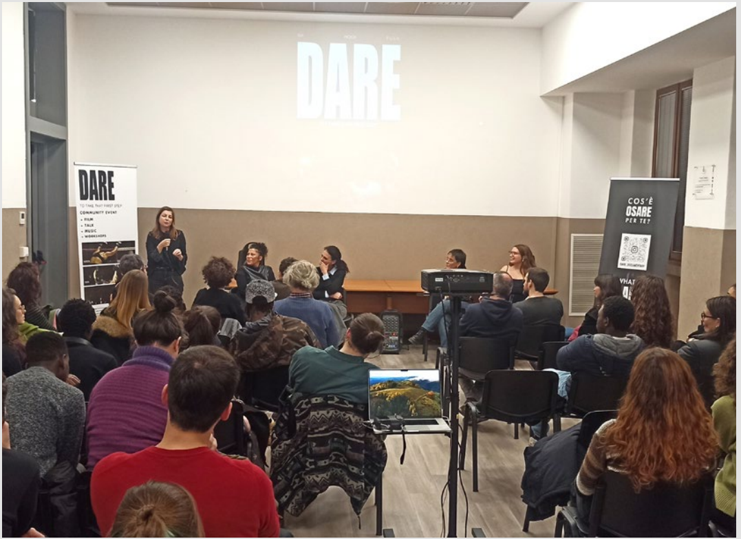
Dibattito sulla proiezione del documentario Dare: To Take that First Step durante l'iniziativa "Rigenerazione urbana su base multiculturale all'Arcella". S. Marini, febbraio 2025.