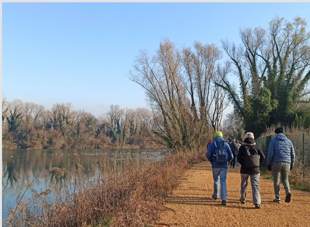
Partecipanti in cammino lungo il fiume durante l'iniziativa "Studiare con i piedi". S. Marini, dicembre 2024.