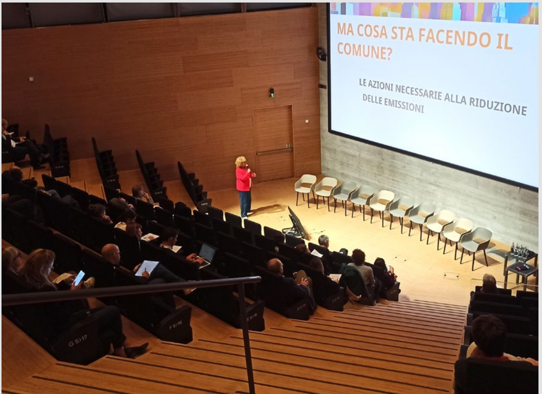
Intervento del Comune di Venezia. S. Marini, ottobre 2025.