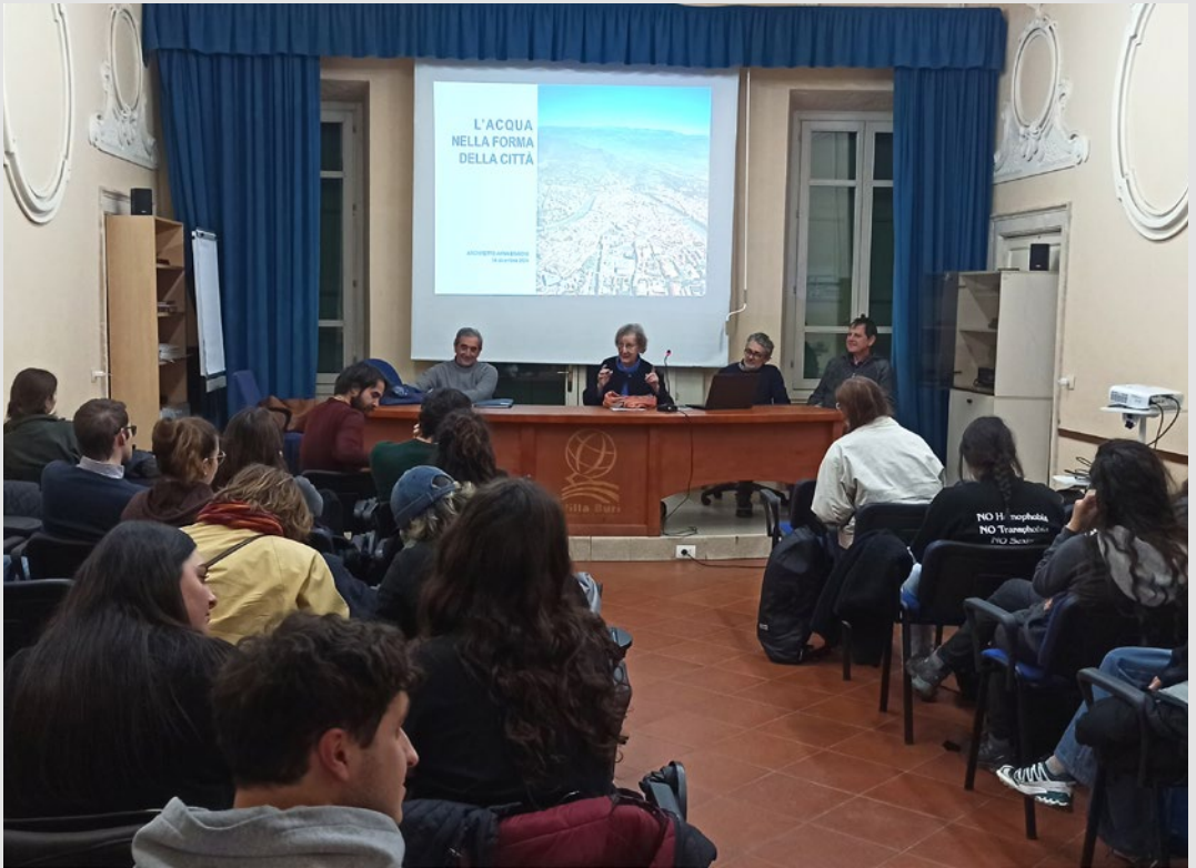
Seminario a conclusione del cammino lungo il fiume durante l'iniziativa "Studiare con i piedi". S. Marini, dicembre 2024.