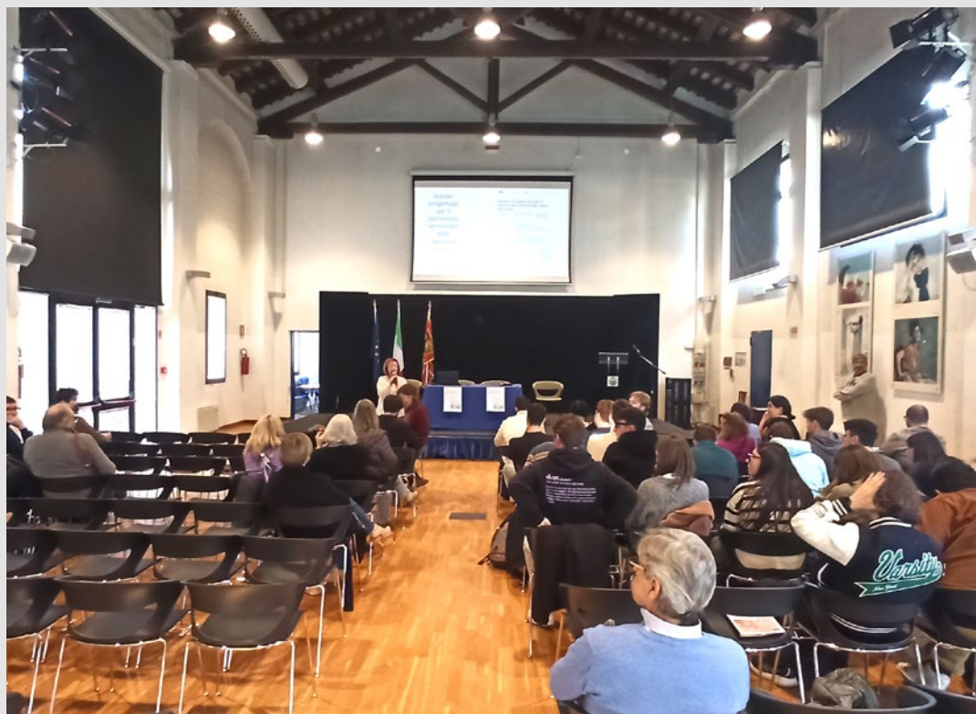
Incontro pubblico realizzato in occasione dell'iniziativa "Scenari progettuali per il patrimonio territoriale della Saccisica a Piove di Sacco". S. Marini, marzo 2025.