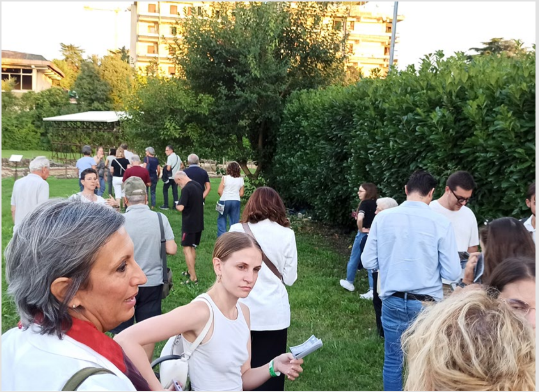
Visita all'area archeologica di via Scavi a Montegrotto Terme svolta durante l'iniziativa. S. Marini, settembre 2025.