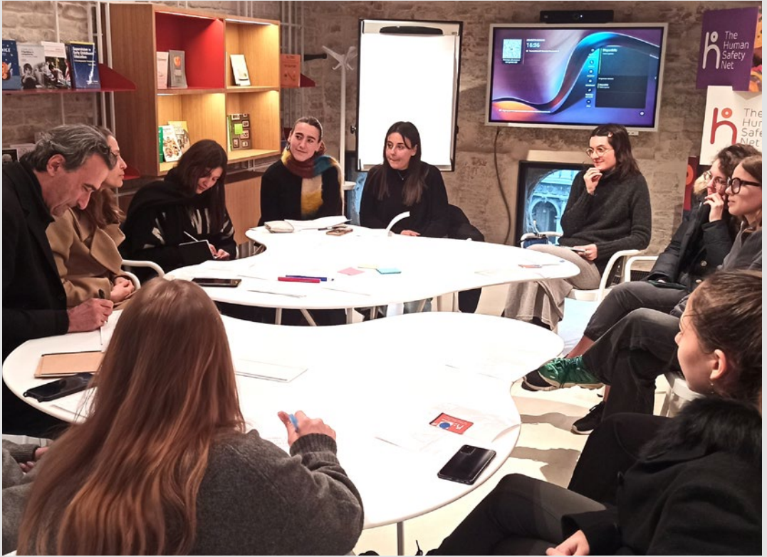
Laboratori di mappatura partecipativa durante l'iniziativa "Fare assieme". S. Marini, gennaio 2025.