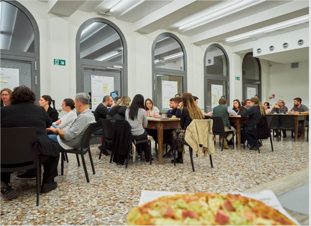
"Startup Pizza". Foto di Università Iuav di Venezia, ottobre 2024.