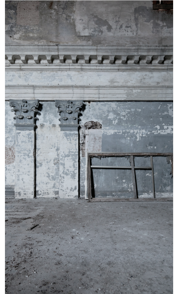
Fig.4, Fig. 5 Chiesa di Sant'Anna, Venezia Sissi Cesira Roselli, Archivio dello scarto. Chiese chiuse, un progetto fotografico, 2015