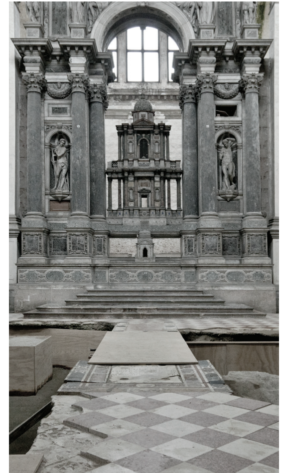
Fig.6, Fig. 7 Chiesa di San Lorenzo, Venezia Sissi Cesira Roselli, Archivio dello scarto. Chiese chiuse, un progetto fotografico, 2015