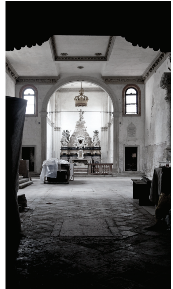
Fig.2, Fig.3 Chiesa di Sant'Andrea Della Zirada, Venezia Sissi Cesira Roselli, Archivio dello scarto. Chiese chiuse, un progetto fotografico, 2015