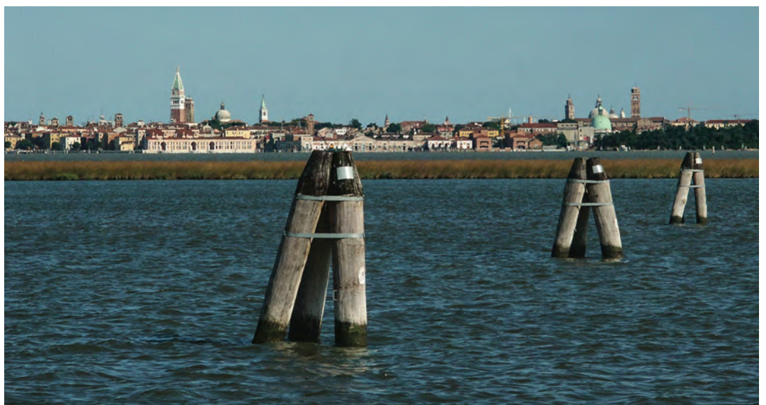
Fig. 5 - View of the project area from the Lagoon.