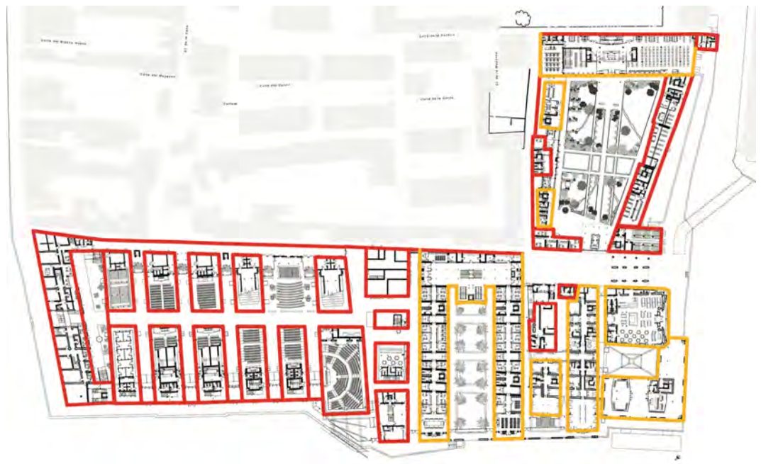
Fig. 6 - General plan for the new university campus. The perimeter of the original walls is shown in red and the new masonry envelope in yellow.

expressive form and substance : compact materials, rough, matt, static on the outside and light, smooth, shiny and dynamic on the inside. By doing this the work has been able to sustainably fit into the outstanding historic context of a Mediterranean city, still expressing its contemporary aspect.