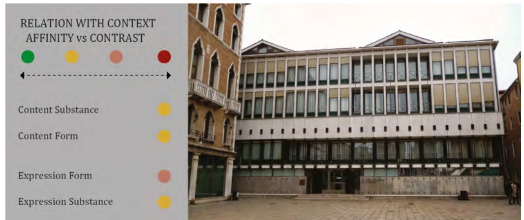
Fig. 2 - Analysis for affinity and contrast relationships according to a semiotic framework. New Venice HQ of the Cassa di Risparmio built in 1972 to a project by Pier Luigi Nervi and Angelo Scattolin.

A design idea structured in this way materializes by means of the conformation structures typical of architecture at expression form level. They are, for example, spatial topology, formal typology, the modular rhythm of plans and facades and the outlining sign system. The project manifests itself to our sensitive receptors through expression substance , that is to say, its construction components, in turn expressed materially with their material-perceptive attributes, particularly visual and tactile (matt, transparent, light, dark, shiny, rough, polychrome, mono color, ...), corresponding to choices concerning the technological-construction aspects and details.