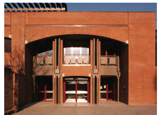
Fig. 9 - One of the entrances to the complex, showing the dynamic, transparent metal structure of the interior, emerging from the apertures in the massive, monolithic brick envelope.