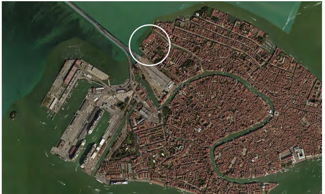
Fig. 3 - Localization of the San Giobbe area in north-west Venice.

This hypothesis is based on a real, important design experience that has been used over the years as a case study with which to validate the theoretical contents of the