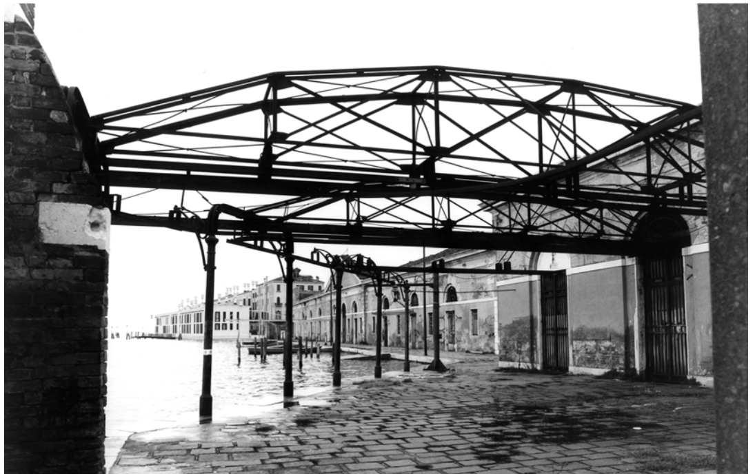
Fig. 4 - The old overhead crane structure in the former Macello (slaughterhouse) in a photograph taken in 1964.