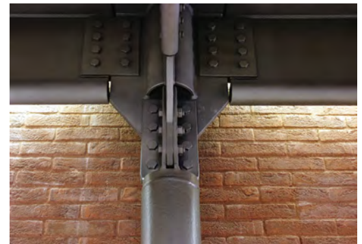
Fig. 8 - Detail showing the newly built internal metal structure enclosed by the masonry shell.