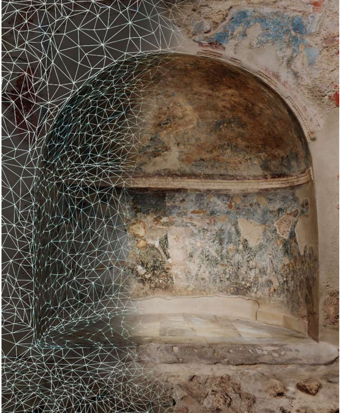
Restituzione digitale del modello fotogrammetrico: in trasparenza la mesh poligonale decimata e ottimizzata Restituzione digitale del modello fotogrammetrico del Frigidarium frutto di un lungo workflow che, a partire dalla mesh generata da Agisoft Photoscan®, ha previsto varie fasi come la decimazione, il filtraggio, la pulizia, l'ottimizzazione della geometria, la correzione del colore e della texture