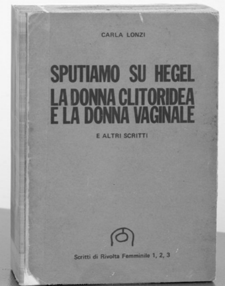
Claire Fontaine, We Are All Clitoridian Women , p. 000