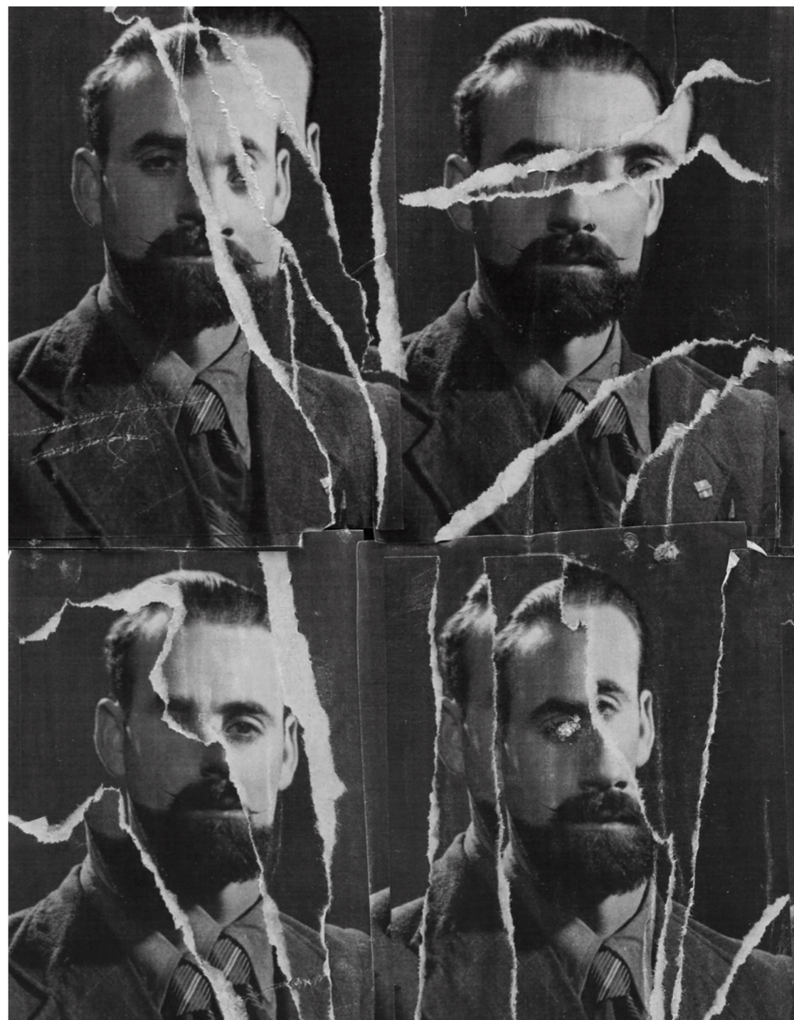
Special project conceived for Dune Journal.

Kensuke Koike is a visual artist based in Venice but working internationally. Like an alchemist he transforms vintage prints, images and objects by means of collage, photo-collage, installation and sculpture. Each of his absurdist and surprising constructions is as intricate as it is precise. His work has been shown in solo exhibitions as well as at art and photography festivals. He has received commissions from numerous brands, including Gucci and Moncler. www.kensukekoike.com