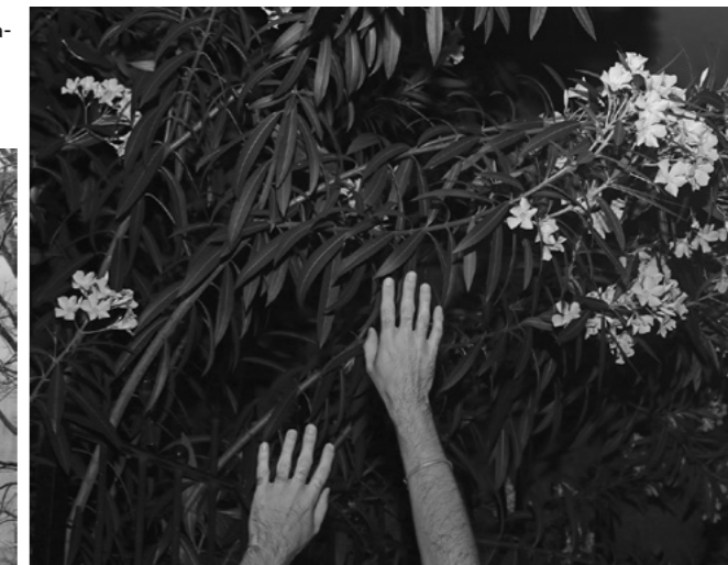
Jacopo Mllani, "Je es un autre" , p. 000