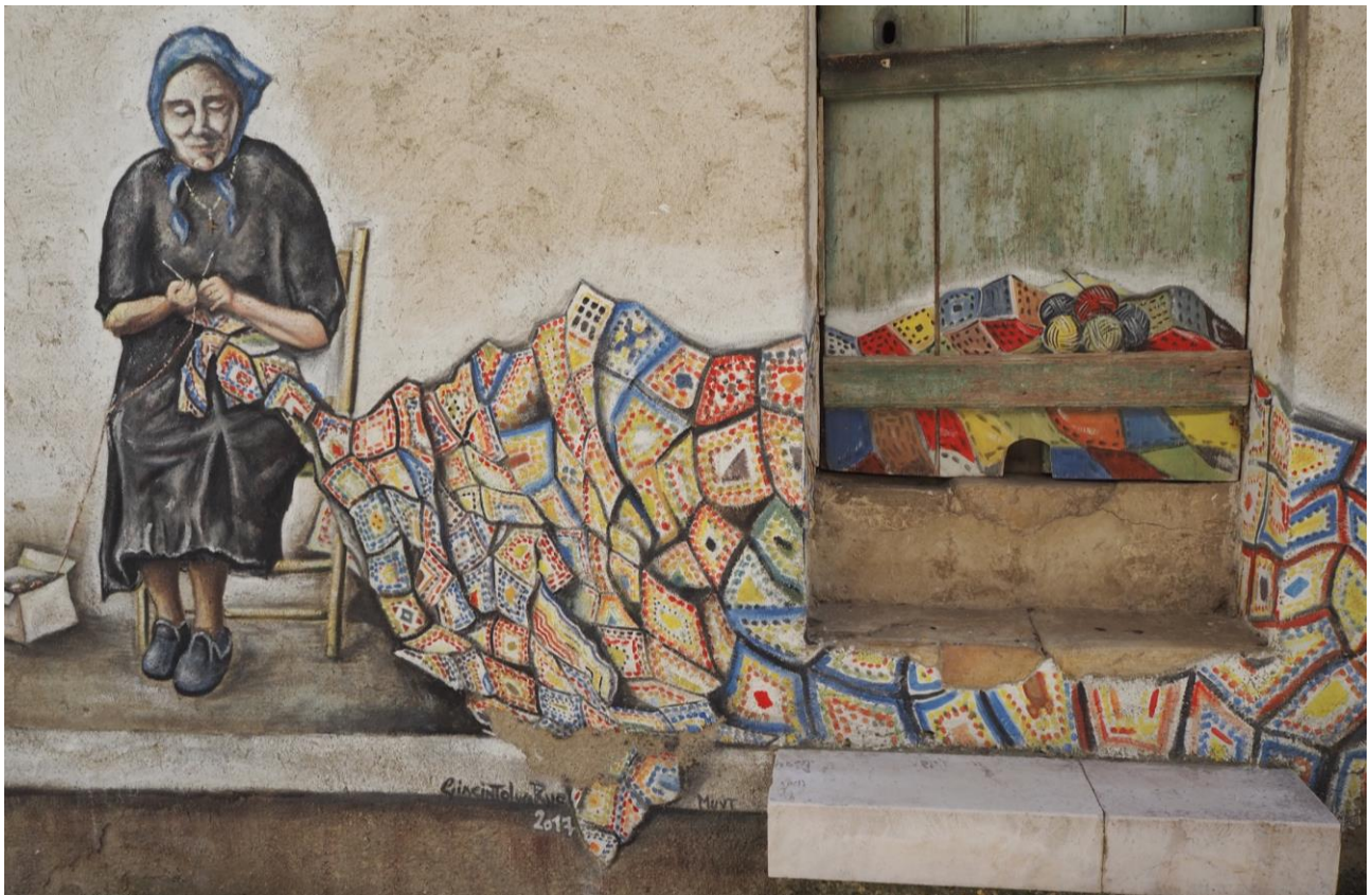
Figura 2 – Comune di Tufara, Area Interna del Fortore. Street Art e murales, tra promozione culturale e attività sociali

La ricerca ha catalogato 14 Piani e programmi, 84 Opere e azioni realizzate e 12 Progetti e concorsi di idee. Di queste 11 rispondono all'obiettivo di Tutela attiva del patrimonio, 63 di Valorizzazione delle risorse, 28 di Attivazione di servizi e politiche sociali, 3 di Attivazione di filiere energetiche e 4 di Saper fare e artigianato. Le pratiche sono suddivise anche per periodo: 9 sono nel periodo 1950-1979, 24 tra 1980-1999, 62 (la maggior parte) tra 2000-2014 e 15 dal 2015 in poi. Sono state raccolte 28 pratiche di tipo strategico, 69 di tipo tattico e 13 di tipo spontaneo.