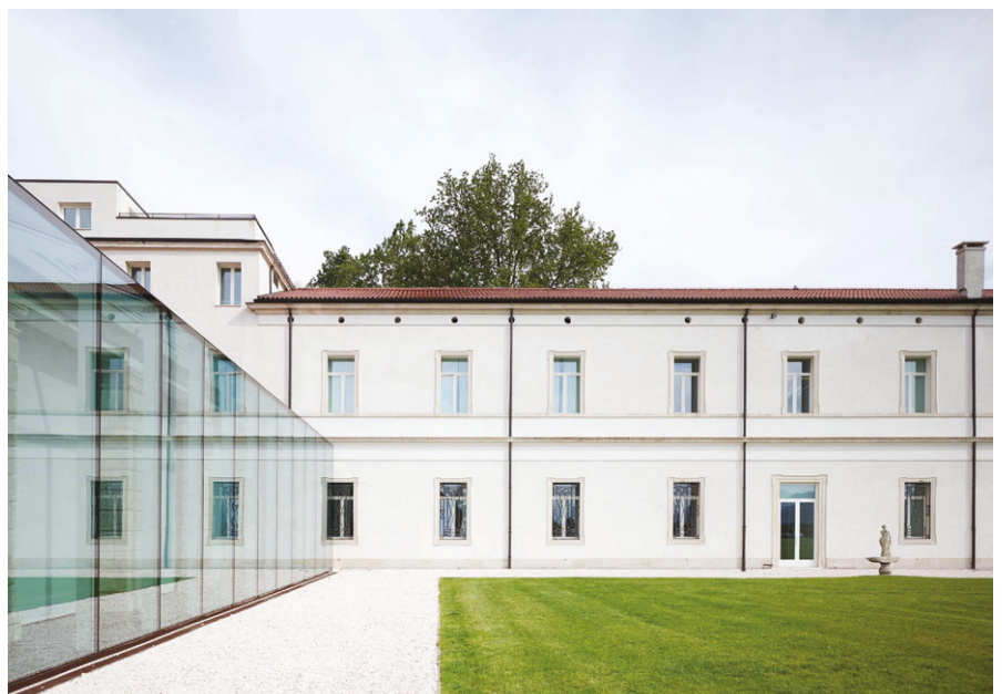
02-03. Atelier Bottega Veneta interno ed esterno, progetto architettonico di Alessandro Fantetti | Interior and external Bottega Veneta atelier, architecture project by Alessandro Fantetti. Hiepler Brunier

profondita su tutti gli aspetti relativi al design della borsa e al suo sviluppo produttivo. La fabbrica, dunque, si è trasformata in uno spazio per l'apprendimento e la sperimentazione di nuove figure professionali.