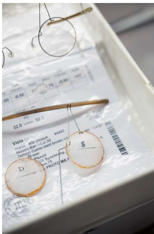
Figura 9: Micromega, 2021.