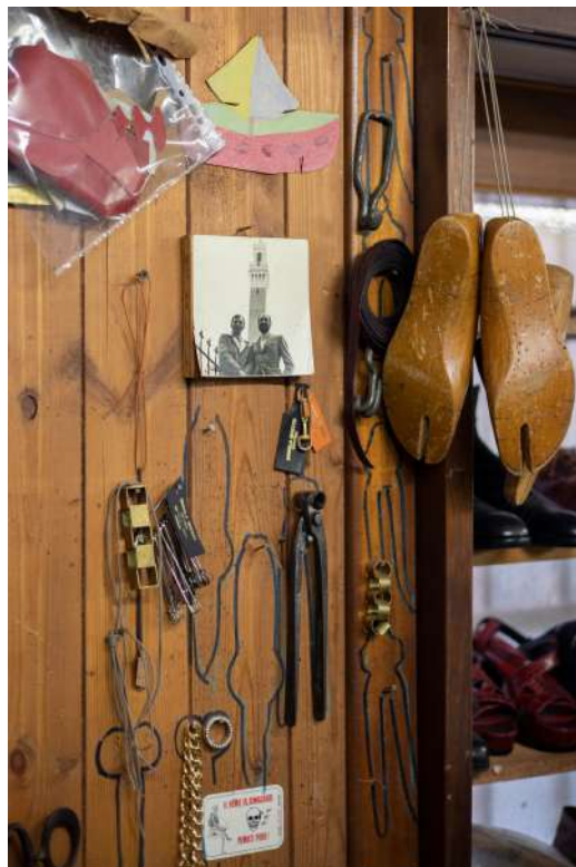
Figura 2: Atelier Segalin di Daniela Ghezzi, 2021.