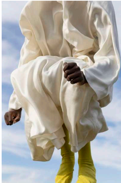
Figura 1: Tabinotabi, 2021.