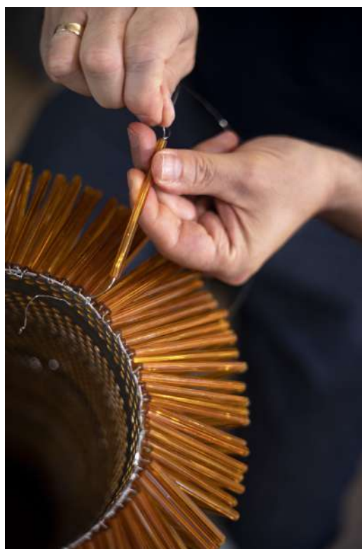
Figura 5: Attombri, 2021.