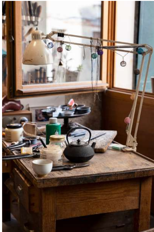
Figura 6: Gabriele Gmeiner, 2021.