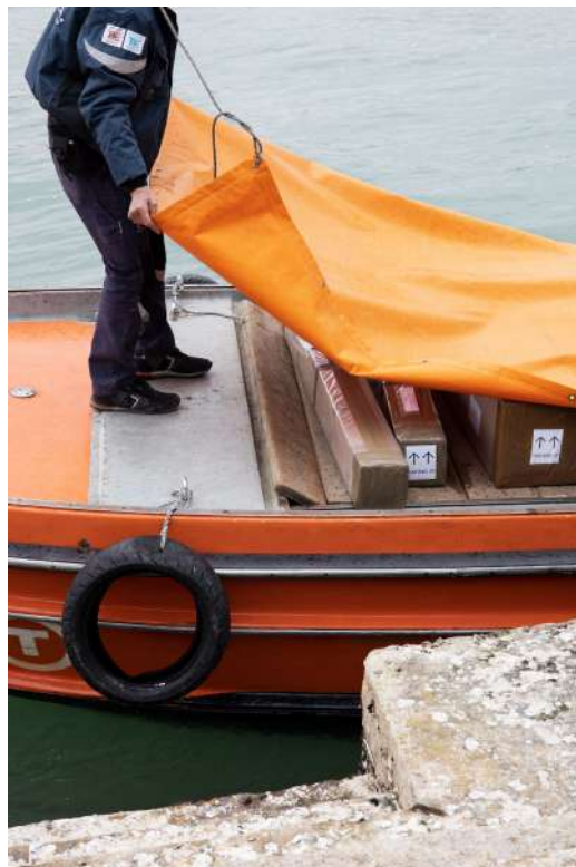
Figura 4: Fortuny, 2021.