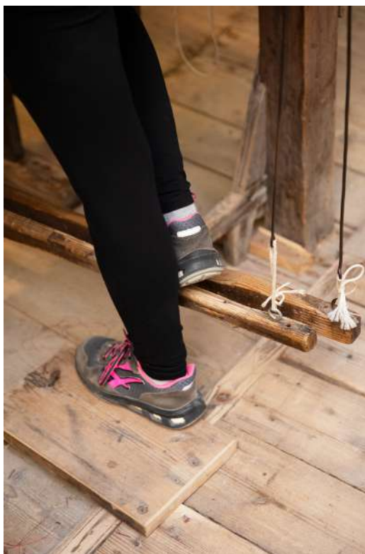
Figura 8: Tessitura Luigi Bevilacqua, 2021.

Inoltre, nei casi analizzati lo sguardo in avanti e la ricerca di innovazione sono altrettanto importanti del passato. Emblematico è il caso di Fortuny, il cui fondatore era un inventore, affascinato dalla ricerca nei campi dell’illuminotecnica, della fotografia, scenografia, oltretutto nei processi di stampa e tintura dei tessuti. Questa eredità sperimentale si ritrova nelle esperienze recenti di brand come Tabinotabi, nato dalla ricerca di tessuti innovativi e sostenibili per la moda e Micromega che ha depositato negli anni vari brevetti per la realizzazione di occhiali senza l’utilizzo di saldature, viti, colle e rivetti (Fig.9).