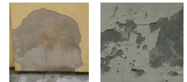
17 Durabilidad de los enlucidos recientes.

existen, con la posibilidad de contar sobre los recientes censos. Las subvenciones a la intervención privada deberían concederse con criterio, incentivando las intervenciones de conservación o integración de las superficies más que las formas de restauración indiscriminada. Al mismo tiempo, las soluciones de restauración deben tener como objetivo la búsqueda de resultados de analogía y pertinencia histórico-arquitectónica del acabado, prefiriendo formas de conservación, integración y mantenimiento. En este aspecto, asumen un rol decisivo la recuperación de formas de artesanía parcialmente perdidas, consintiendo la reutilización de materiales de reciclaje en la formación de la masa de los enlucidos (cocciopesto y marmorino), y la previsión de las formas de degradación de los materiales usados, de modo que se eviten fenómenos repentinos que anulen en poco tiempo el decoro de las fachadas tan anhelado que provocó la sustitución del enlucido. Sólo de esta forma se puede mantener viva la imagen de Venecia sin que se transforme en un producto de su progresiva y arbitraria mercantilización.