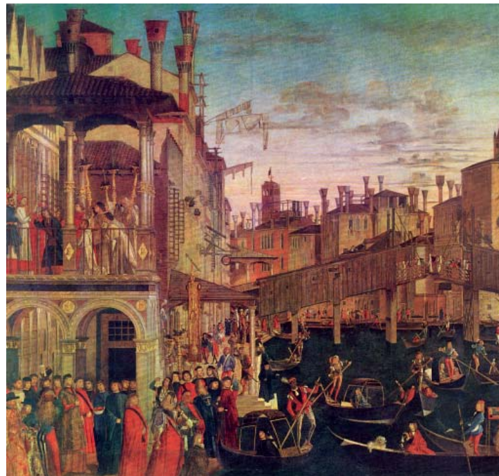
1. Pintura de Vittor Carpaccio.

“... probablemente es el inicio de una ciudad que no conocemos... La ciudad sueña con ser la de siempre. Parece que no hubiera pasado nada, quedan las estructuras externas, y ya es mucho: esperan, remiten, evocan (...) Desafortunadamente ahora aparece repintada, en comparación con las demás que esperan su turno sobre el agua. Aquí un amarillo brillante, uniforme, demasiado amarillo y uniforme, sobre toda la fachada. Un poco más allá, un tremendo blanco marfil brillante, sobre otra fachada en plena luz. Todas las fachadas que transforman en un intento de afrontar la degradación, pero ya no parecen vivir en Venecia. Han perdido sus viejos colores, las consistencias mutables, las relaciones con el entorno, los siglos, el tiempo”. (Paolo Barbaro, Venezia. La città ritrovata, 1998).