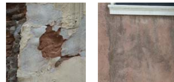
16. Incorrecciones gramaticales constructivas en el tratamiento de aperturas angulos y basamentos.

existen, con la posibilidad de contar sobre los recientes censos. Las subvenciones a la intervención privada deberían concederse con criterio, incentivando las intervenciones de conservación o integración de las superficies más que las formas de restauración indiscriminada. Al mismo tiempo, las soluciones de restauración deben tener como objetivo la búsqueda de resultados de analogía y pertinencia histórico-arquitectónica del acabado, prefiriendo formas de conservación, integración y mantenimiento. En este aspecto, asumen un rol decisivo la recuperación de formas de artesanía parcialmente perdidas, consintiendo la reutilización de materiales de reciclaje en la formación de la masa de los enlucidos (cocciopesto y marmorino), y la previsión de las formas de degradación de los materiales usados, de modo que se eviten fenómenos repentinos que anulen en poco tiempo el decoro de las fachadas tan anhelado que provocó la sustitución del enlucido. Sólo de esta forma se puede mantener viva la imagen de Venecia sin que se transforme en un producto de su progresiva y arbitraria mercantilización.