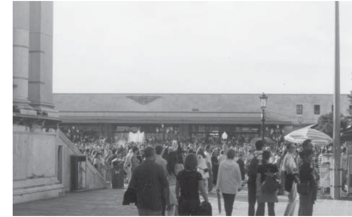
2. Turistas en Venecia, zona Ferrovia.

probablemente su máxima expresión en la idea romántica de “sublime ruina decadente” de Las Piedras de Venecia de John Ruskin, por otro existe una imagen real y tangible, de alguna manera lejana de la turística que empuja a millones de visitantes a la ciudad lagunar.