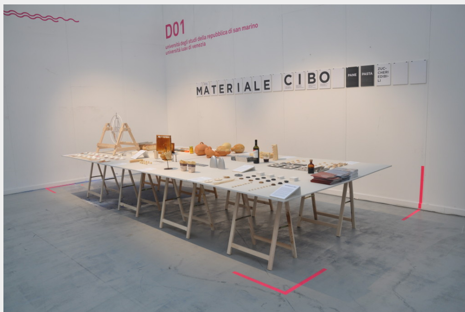
"Materiale Cibo. Pane, pasta, zuccheri edibili", mostra dei Corsi di laurea in Design di San Marino ad "Operae" 2014.

Dal 10 al 12 ottobre 2014 i Corsi di laurea in Design dell'Università degli Studi della Repubblica di San Marino hanno partecipato ad "Operae", festival del design indipendente di Torino, con la mostra Materiale Cibo: sperimentazioni su pane, pasta e zuccheri edibili , allestita presso gli spazi di Torino Esposizioni.