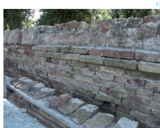
14a-b. Convento de los Santos Cosme y Damiano: la puerta tapiada antes y después de la restauración