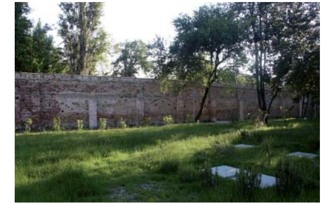
Convento de los Santos Cosme y Damián: vista del muro perimetral antes y después de la restauración

un punto de vista semiótico, se asiste al paso del concepto de cualidad formal a la cualidad entendida como “modo de aparecer de la materia”, encomendado a la superficie que “se vuelve interfaz, es decir, lugar privilegiado de intercambios de energía e información” 41 .