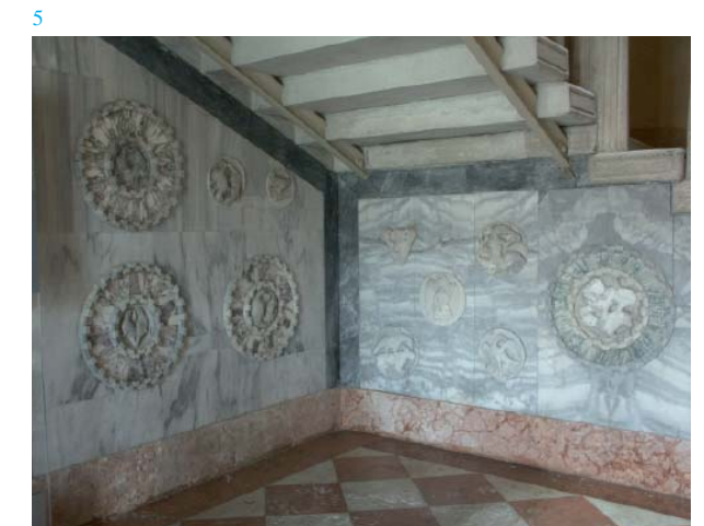
5. Partes antiguas e integraciones de las partes recolocadas en el interior del Fondaco 6. Los mármoles de la Basílica de San Marcos en Venecia

El Castillo de Rivoli, cerca de Turín, es una residencia de los Savoya a cuya formación contribuyeron los principales arquitectos de la corte, desde el siglo XVI hasta 1718, con el gran proyecto de Filippo Juvarra cuya realización se interrumpió en 1734. La restauración, impulsada por el intento