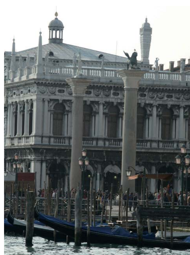
2. Venezia, la Piazzetta con le due colonne di fronte al bacino di S.Marco

En términos de materialidad, se asiste a la transición del interés desde la integridad formal a la materia signata, o conjunto de las trazas materiales. A esta apertura que aboca la instancia estética al cauce más amplio de la instancia histórica, se añade la posibilidad de una fruición estética 16 de objetos no necesariamente dotados de voluntad artística. En términos de temporalidad, adquieren importancia dos connotaciones comprendidas en la noción de duración: la referida a la creación, que ya no queda confinada en el origen de la obra sino que se extiende también al proceso de transformación de la misma; y la que afecta a la percepción del objeto en el tiempo, que puede constituirse en un enfoque diacrónico o sincrónico, o incluso en una especie de entrelazado de temporalidades diversas. Una vez más surge Alois Riegl como referencia. K.W. Forster enfatiza la modernidad de Riegl en su conciencia de la transi-