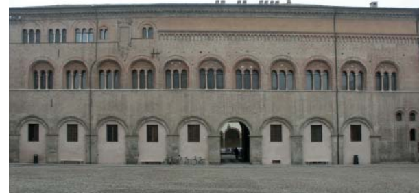
9a-b. Castillo de Rivoli: vista del saliente estructural suspendido sobre el atrio incompleto restaurado