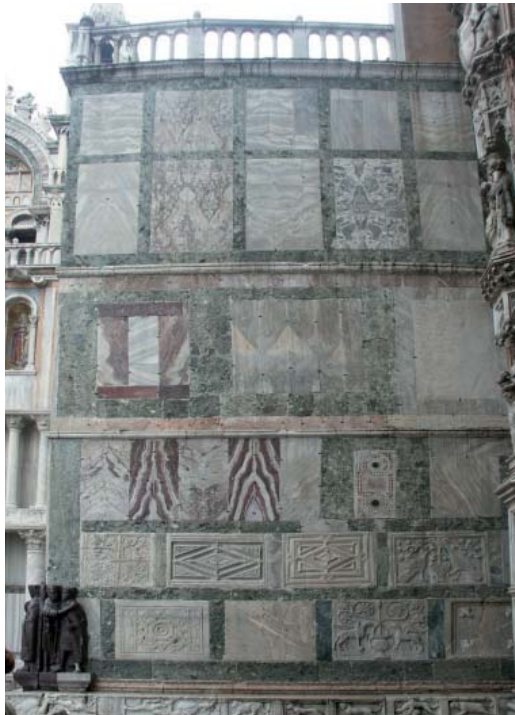
1. Los marmoles de la Basílica de San Marcos en Venecia

“(…) En Venecia el tiempo no transcurre como en otros lugares. La ciudad está fuera de (…) (los) puntos de referencia, que no tienen nunca la misma edad, conviven y se confunden, mezclándose con el pasado e intersectándolo incesantemente. No existen lenguajes diferentes, sino un único lenguaje que se compone de todos (...). Armonía, fusión y también atemporalidad (...) La Piazzetta nos hipnotiza como hipnotizaba a Marcel Proust (...). Las pasiones (...) marcan todo el paisaje (...) de las tintas de la proximidad, de los tonos de la lejanía (...) (F. Braudel, 1949).