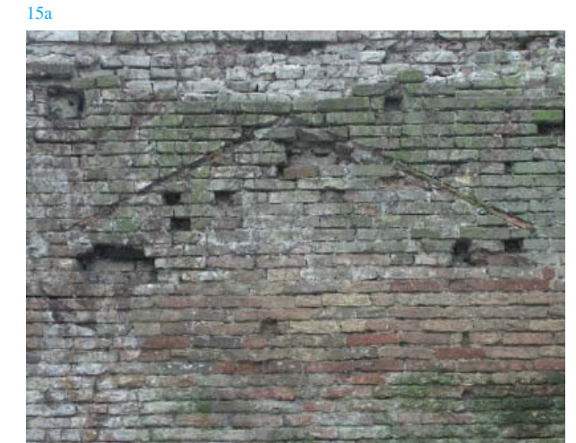
15 a-b-c. Convento de los Santos Cosme y Damiano: interfaz de demolición de la cubierta antes de la restauración, planos de los diferentes niveles de reparación y el resultado final de la intervención

Una posible caracterización no lineal del tiempo está abierta a nuevas experiencias en el futuro al concebir la aproximación a la antigua construcción en un sentido plural, reconociendo la posibilidad del conocimiento también a canales perceptivos y emotivos. Vuelve la idea benjaminiana de la lengua como fruto de una evolución desde lo sensible hacia lo intelectual, donde “junto a la comunicación espiritual de las lenguas humanas, existe una material propia del lenguaje de las cosas (...) ‘la magia de la materia’ (...) la muda intensidad de