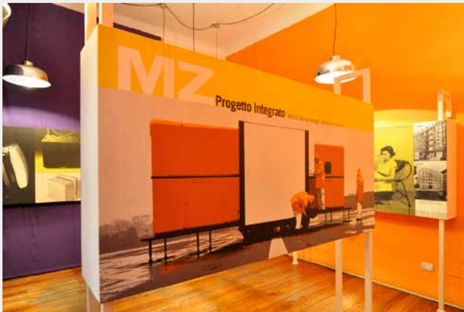
MZ Progetto integrato. Marco Zanuso: design, tecnica e industria, 9-30 aprile 2013, Ordine degli Architetti della Provincia di Milano.

Complessivamente le tre iniziative si propongono come un'opportunità di riflessione sulla figura di uno dei maggiori progettisti italiani e, trasversalmente, come occasione di valutazione e rivalutazione dell'importanza dei materiali di archivio che permettono di far conoscere il lavoro di un architetto-designer nella sua complessità, raccontando contemporaneamente più storie, capaci di incuriosire e coinvolgere il visitatore che da un lato si confronta direttamente con il vissuto dell'autore, dall'altro scopre, celate tra i documenti, storie di innovazione, di tecniche, di economia e di industria che, in parallelo, concorrono a ricostruire parti di una più importante storia.