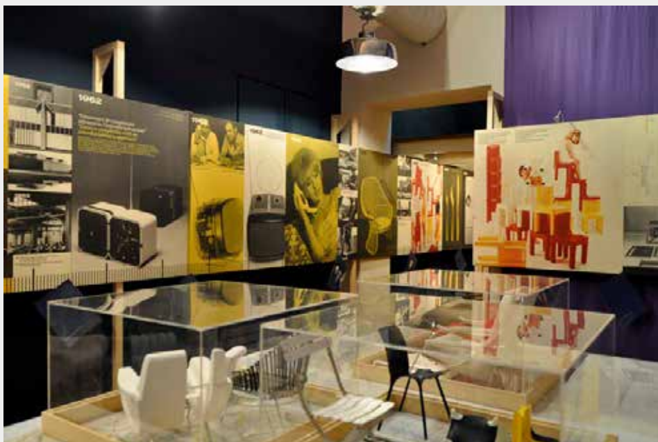
MZ Progetto integrato. Marco Zanuso: design, tecnica e industria, 9-30 aprile 2013, Ordine degli Architetti della Provincia di Milano.