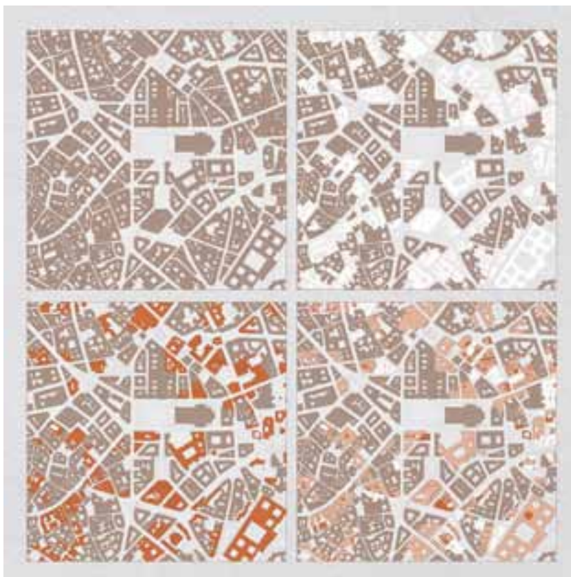
Fig. 2 - Un esempio delle lastre temporali realizzate per Milano: in alto a sx prima della seconda guerra mondiale, in alto a dx con gli edifici distrutti, in basso a sx la ricostruzione al 1965 e in basso a dx la mappa delle trasformazioni 1944-1965.

An example of the temporal plates made for Milan: top left before WWII, top right with the destroyed buildings, bottom left the reconstruction in 1965 and bottom right the transformation map 1944-1965. Source: Urbicide Task Force, Università Luav di Venezia.