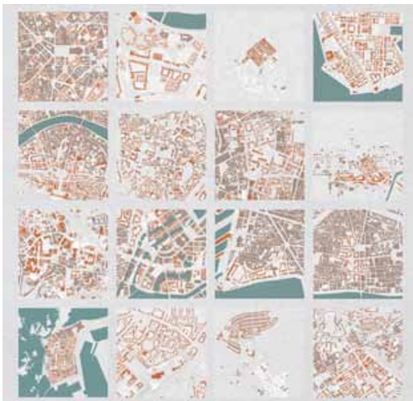
Fig. 3 - Mappe delle trasformazioni di città coinvolte nelle distruzioni della seconda guerra mondiale: Milano (1944-1965), Dresda (1945-1989), Brunete (1937-1946), Le Havre (1944-1964), Pisa, (1943-1960), Münster (1944-1964), Londra (1940-1982), Guernica (1937-1956), Coventry (1943,1962), Amburgo (1943-1960), Marsiglia (1943-1958), Orleans (1940-1960), Saint Malo (1944-1961), Kassel (1943-1970), Belchite (1937-1964), Caen (1944-1957). Fonte: Urbicide Task Force, Università Iuav di Venezia.

Transformation maps of cities involved in the destruction of WWII: Milan (1944-1965), Dresden (1945-1989), Brunete (1937-1946), Le Havre (1944-1964), Pisa (1943-1960), Münster (1944-1964), London (1940-1982), Guernica (1937-1956), Coventry (1943,1962), Hamburg (1943-1960), Marseille (1943-1958), Orleans (1940-1960), Saint Malo (1944-1961), Kassel (1943-1970), Belchite (1937-1964), Caen (1944-1957). Source: Urbicide Task Force, Università Iuav di Venezia.