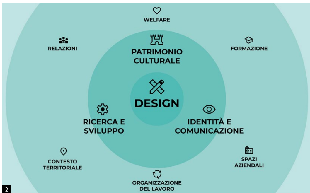
2 Diagramma del sistema di indicatori sviluppato nell'ambito della ricerca.

Le realtà imprenditoriali oggetto delle nostre indagini sul campo si mostrano per la maggior parte coscienti del ruolo strategico che archivi e musei potrebbero potenzialmente svolgere al fine di promuovere e incrementare la meta-produzione culturale attorno al proprio marchio (in termini, ad esempio, di divulgazione scientifica, dibattito mediatico, eventistica culturale). Tuttavia, problematiche connesse ad esempio alle complicazioni economiche e logistiche imposte dall'archiviazione e dalla conservazione dei materiali, all'incompatibilità con la gestione dei ritmi produttivi, alle difficoltà nel reperimento di personale specializzato, tendono spesso a inibire l'effettiva attivazione di tale genere di organismi, precludendo alle imprese un importante canale di valorizzazione del proprio patrimonio intangibile.