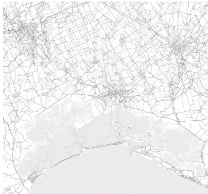
L. Velo, S. Conz, Laguna ciclabile , 2023. Illustrazione dal volume Laguna Futuri: Esperienze e progetti dal territorio veneziano .