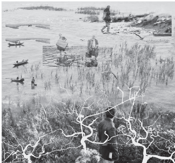
A. Chouairi, Inerzia e Abbandono , 2023. Illustrazione dal volume Laguna Futuri: Esperienze e progetti dal territorio veneziano .